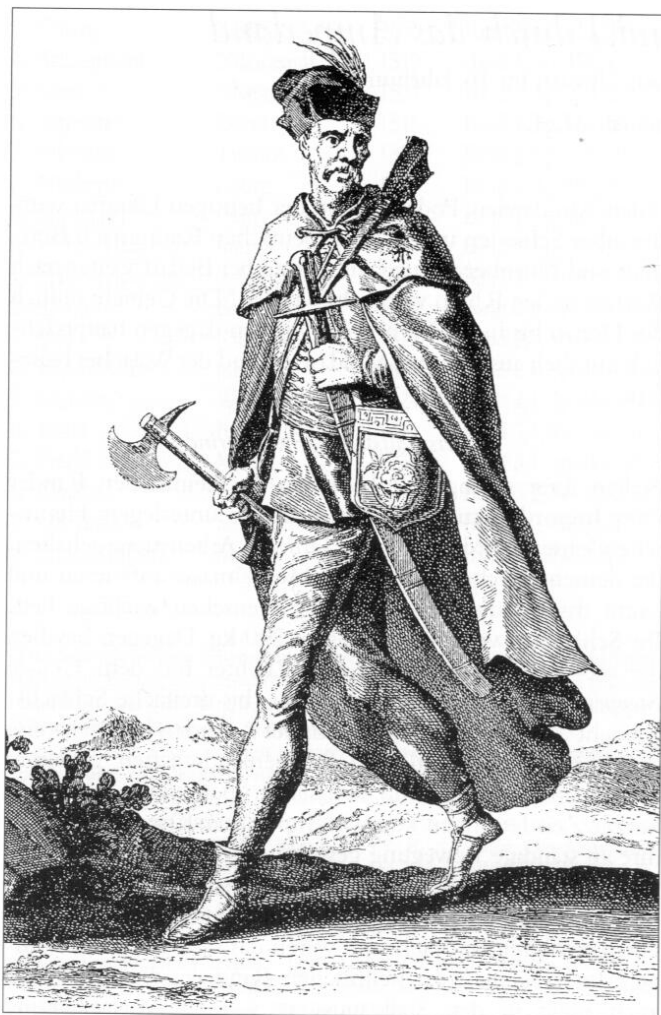
Haiduck in Kriegstracht.