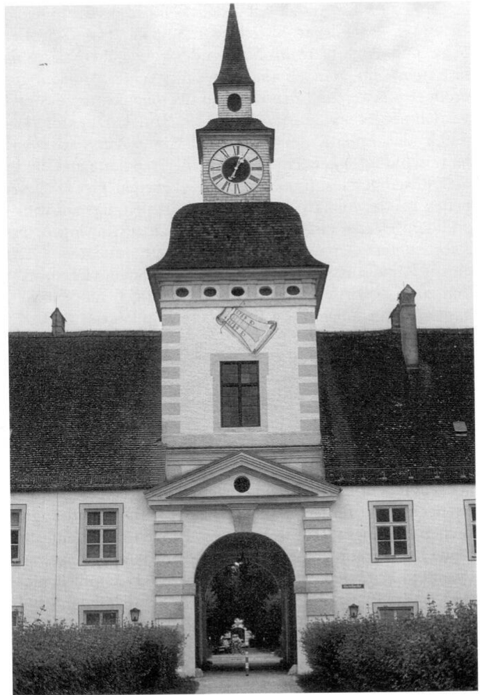
Altes Schloss in Schleißheim.

In Weißenstephan hatte man in diesen Tagen alle Vorbereitungen für die Neueröffnung getroffen. Nach Einrichtung der Forst- und Musterlandwirtschaftsschule unter Däzel 4 und Schönleutner in den Jahren 1803/04 war dies der zweite Neuanfang in Weißenstephan. Gemäß Kgl. Entschliebung vom 18. September 1852 wurde festgelegt, »die zu Schleißheim bestehende Centralschule mit dem Beginn des nächstkünftigen Schuljahres nach Weißenstephan zu verlegen und ihr das dortige Staatsgut zum eigenen Betriebe als Musterwirtschaft, sowie zur gleichzeitigen Benutzung für den praktischen Landwirtschafts-Unterricht zu überweisen (...).« 5 Veit wurde angewiesen, das in Schleißheim befindliche Schulinventar und das Staatsgut Weißenstephan an den neuernannten Direktor Johann Carl Christian Helferich (1816–1865) zu übergeben. Die Übergabe, über die ein ausführliches Protokoll angefertigt wurde, zog sich über Wochen hin. Als erstes