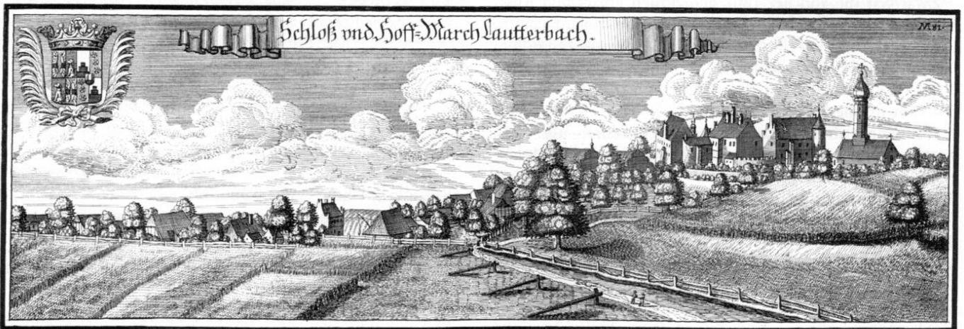
Lauterbach um 1701, seit 1439 in Besitz der Familie von Hundt.