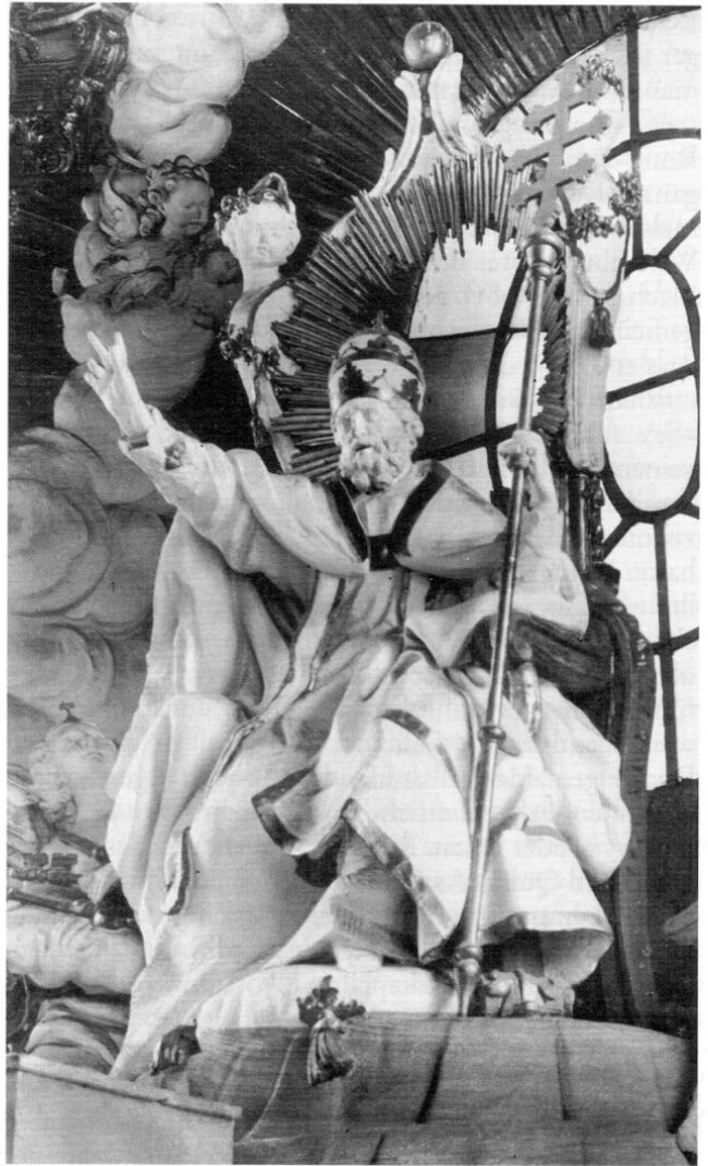
Thronender Petrus im Zentrum des Hochaltars von Sandizell.

Im Februar 1732 kam dann wenigstens noch Egid Quirin Asam in der Münchner Peterskirche zum Zug. Der Dekan konnte mit ihm einen Kontrakt über die Lieferung von Lindenholzfiguren der »Vier Khürchenlehrer« und einem »Stuell St. Petri« mit bekrönenden Putten schließen. Am 26. September 1733 wurden sie dem Altar eingefügt. Doch noch 1738 musste Asam die Zah-