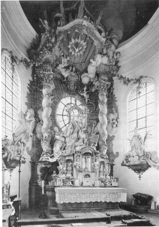
Hochaltar von Egid Quirin Asam in der Peterskirche zu Sandizell.