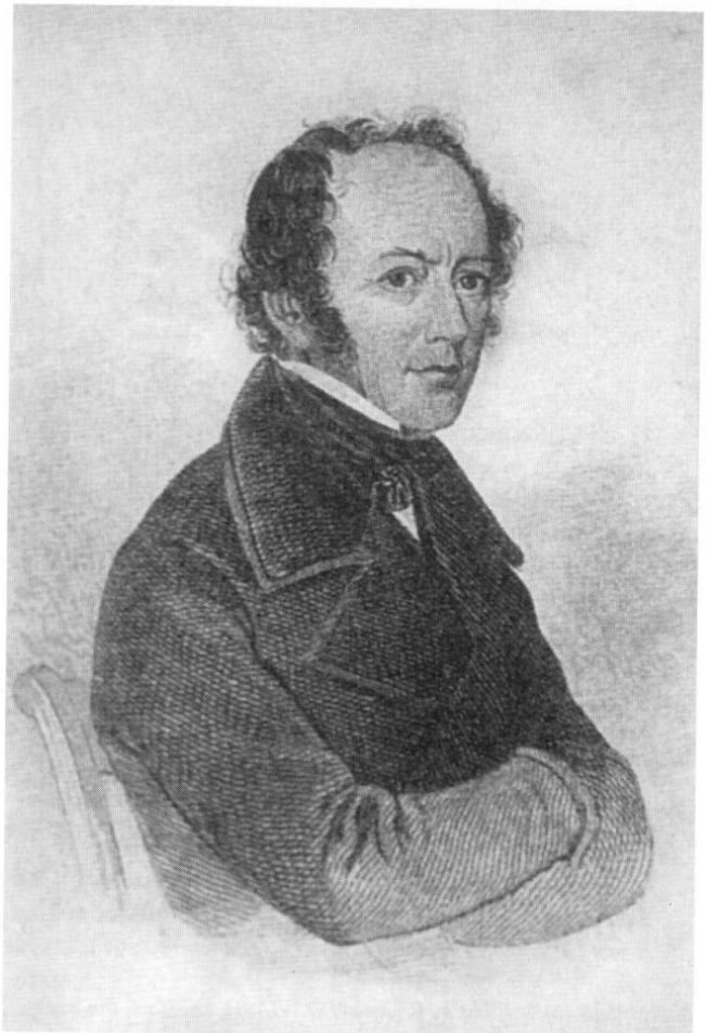
Johann Baptist Stiglmaier, *18. Oktober 1791 in Fürstenfeldbruck, † 2. März 1844 in München, in einer Lithografie.

Die Kapazität der Gießerei wurde freilich immer wieder vom Fortschritt der Produktionstechnik, von den zunehmenden Aufträgen sowie der Größe der Guss-