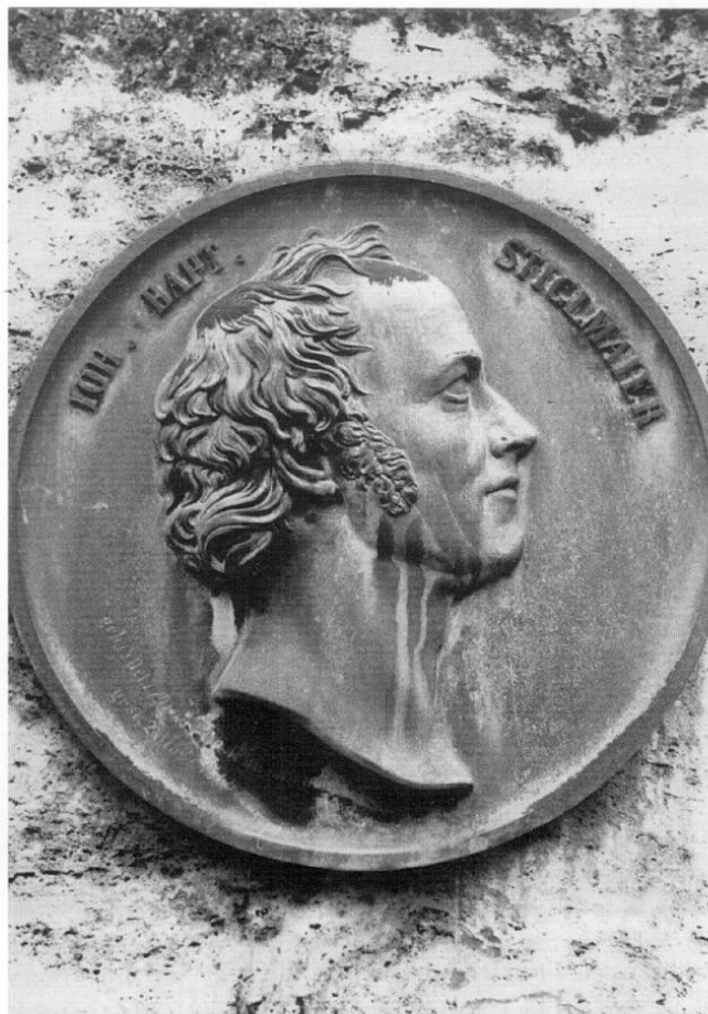
Auf dem Winthier-Friedhof in München-Neuhausen hat der königliche Erzgießer seine letzte Ruhestätte gefunden.

Johann Baptist wurde dort am »Dienstag, 18. Oktober 1791 zwischen 7 und 8 Uhr früh« geboren (am gleichen Datum 1813 übrigens auch sein Neffe und Nachfolger