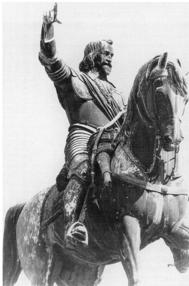
Maximilian I., Kurfürst in Bayern (1573–1651), zählt zu den Hauptwerken des Erzgießers Johann Baptist Stiglmaier. Der Entwurf des seit 1839 auf dem Wittelsbacherplatz in München stehenden Denkmals stammt von Bertel Thorwaldsen.