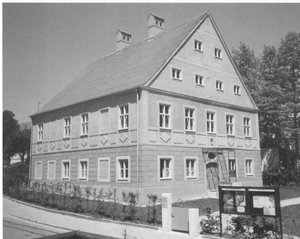
Der restaurierte Pfarrhof in Haimhausen 2001.

weise geschah, machte jährlich nur ein ganz geringes Quantum aus.«