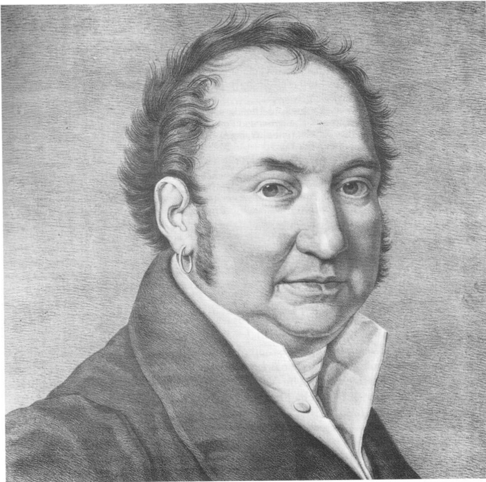
Der Vater, Kurfürst Max IV. Joseph bzw. König Max I. Joseph von Bayern, regierte Bayern von 1799 bis 1825 mit seinem Minister Maximilian von Montgelas. 1802 benannte er eine Mooskolonie zwischen München und Dachau nach seinem Sohn Carl als Karlsfeld.