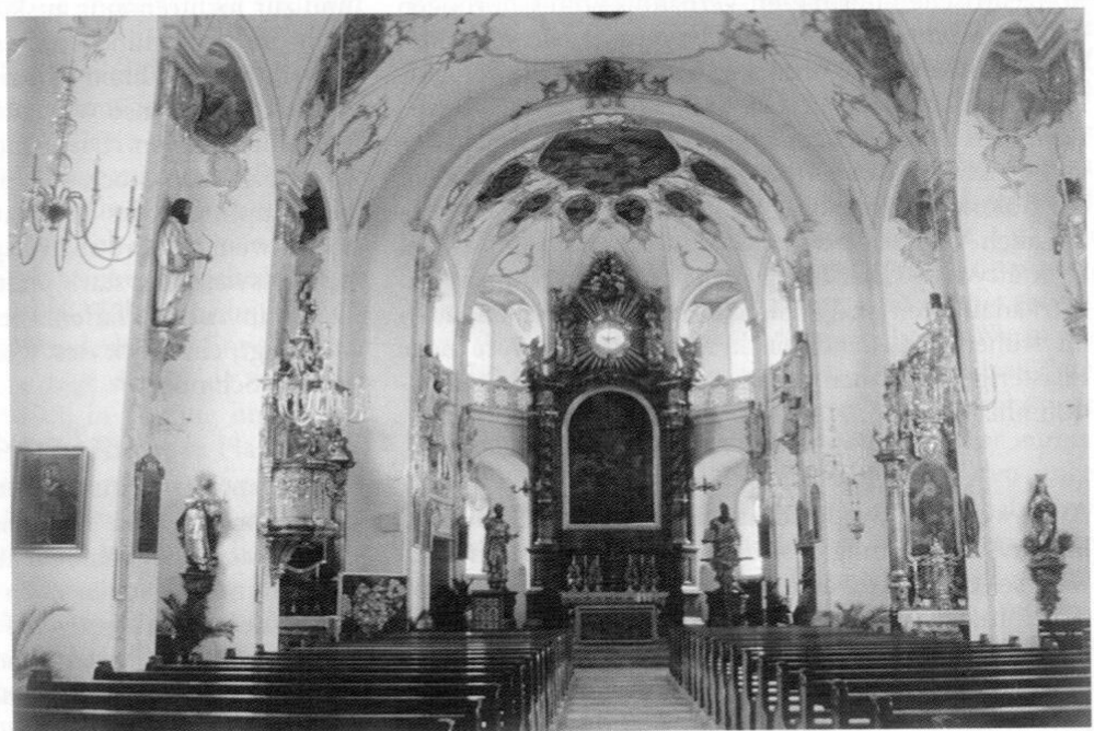
St. Magdalena: Innenraum nach Süden.

übereinander und ein Okulus knapp darüber. Es gibt keinen Zweifel, dass die auch im Stich von Wening überlieferte Anordnung vor 1764 an allen Chorfenstern so aussah. 23 Alle malerischen Elemente sind ansonsten am Außenbau der neubarocken Renovierung von 1913 zuzuschreiben. Allerdings gab es ursprünglich eine