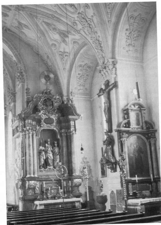
Markt Schwaben: Pfarrkirche gegen Südost.