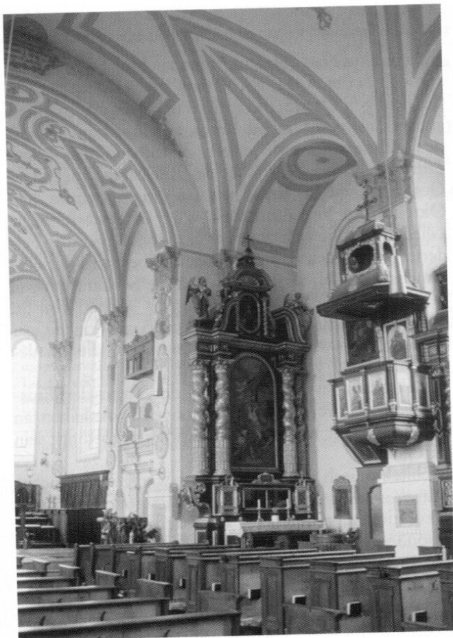
Anzing: Pfarrkirche gegen Südost.