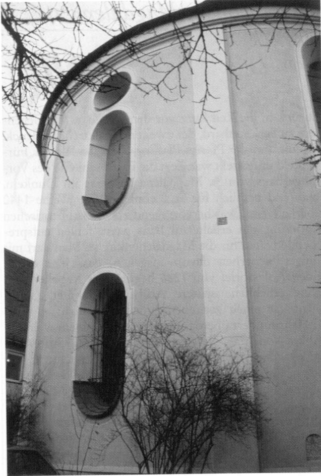
Fürstenfeldbruck, St. Magdalena: Fenster am Chorscheitel.

spätgotische Landkirche vorstellen dürfen, deren Chor leicht eingezogen war, polygonal schloss und mit einem Rippengewölbe überdeckt war. Ob auch das Langhaus (wie in St. Leonhard) gewölbt war oder wie z. B. St. Willibald bei Jesenwang eine Holzdecke besaß, muss offen bleiben.