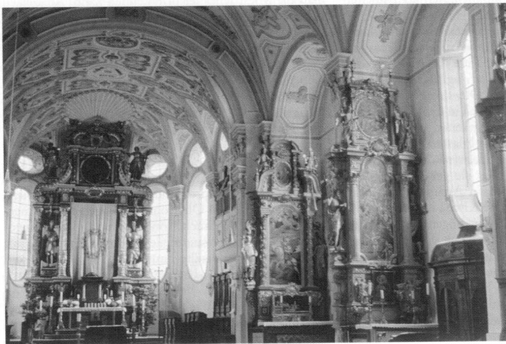
Habach: Pfarrkirche gegen Südost.

Die Bauten der Zwergers zeigen durchaus räumliche Qualitäten; der stets zugehörige Stuckdekor und der unbekümmerte Umgang mit Gliederungselementen tragen aber nicht unwesentlich zu einem ländlichen Charakter bei, der sich von den feierlich strengen Gründungsbauten des bayerischen Barock wie den Jesuitenkirchen in München und Dillingen abhebt. Durch die Rokoko-Umgestaltung wandelte der Innenraum von St. Magdalena zu einem gewissen Grad seinen Charakter, dank der naiven Baldauf-Fresken blieb aber ein gewisser volkstümlicher Zug erhalten.