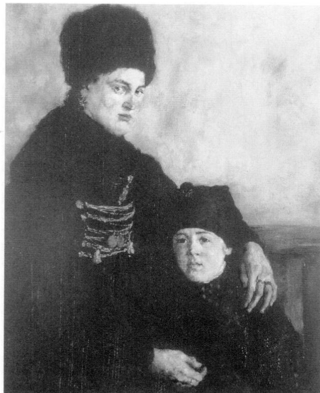
»Dachauerin mit Kind«, 1874/75.