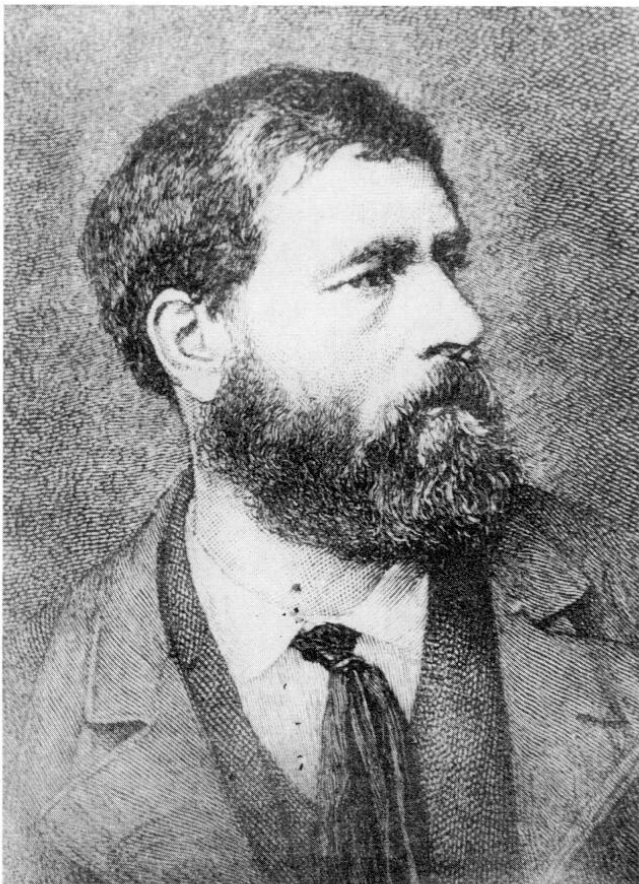
Wilhelm Leibl, Selbstporträt, 1871.