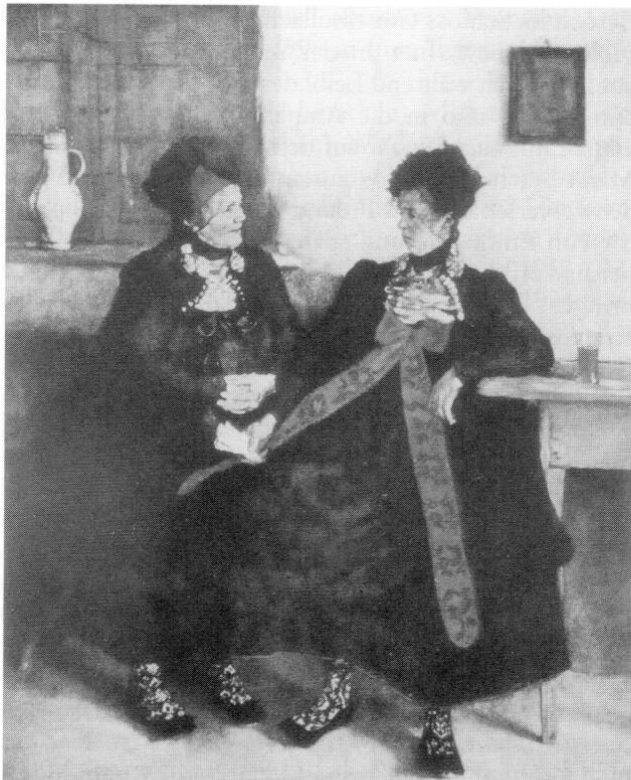
»Zwei Dachauerinnen«, 1874/75.