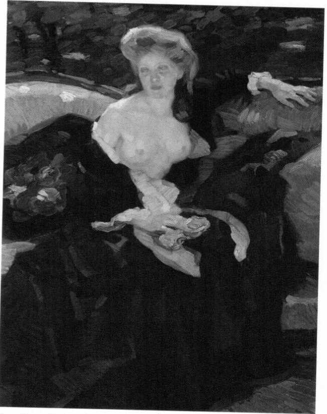
Leo Putz, Sommerträume , 1907, Öl auf Leinwand, 119,5 x 110 cm. Bez. u. r.: »Leo Putz 07«

Putz war auch als Dozent tätig: 1901–1908 an der »Damenakademie« des Künstlerinnen-Vereins in München – Frauen waren damals an der Kunstakademie noch nicht zugelassen –, ab 1909 an der Akademie der bildenden Künste selbst und sogar kurzzeitig an der