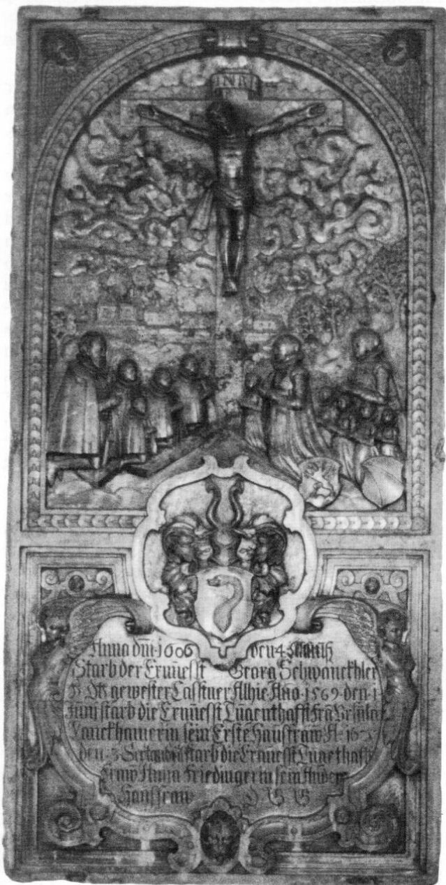
Schwankler'sche Grabplatte in der Pfarrkirche St. Jakob Dachau.