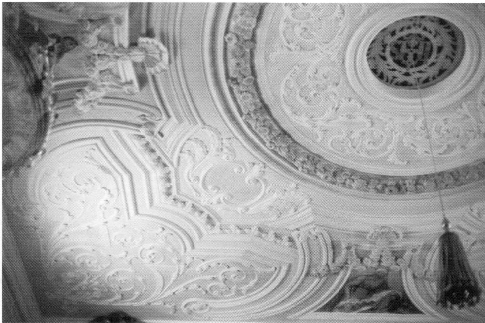
Asbach bei Petershausen, Pfarrkirche St. Peter: Stuck im Langhaus.

Obb. (S. 1024) »neubarocker Stuck« ist sicher irrtümlich.