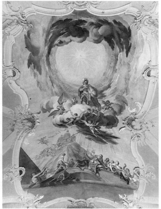
St. Georgen bei Dießen, Langhausfresko 1750. St. Georg als Verteidiger der Kirche und als Helfer der Bedrängten. Das Fresko zeigt Motive aus Bergmüllers Dießener Fresken.

Schließlich erwähnt Zitter noch private Restaurierungsaufträge, so bei Schatzmeister Lorek und bei verschiedenen Herrschaften in München, die zur allgemeinen Zufriedenheit ausgefallen seien. In diesem Zusammenhang bezieht er sich auf den »berühmten französischen Maler in Mannheim«.