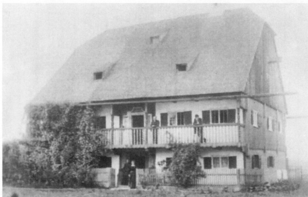
Fürholzer Pfarrhof anno 1894, erbaut 1682, abgebrochen 1904.

Im Dezember 1869 aber zeichnete sich das Ende der