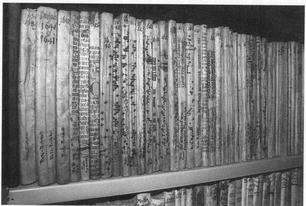
Die ältesten Ratsprotokolle des Marktes Dachau.