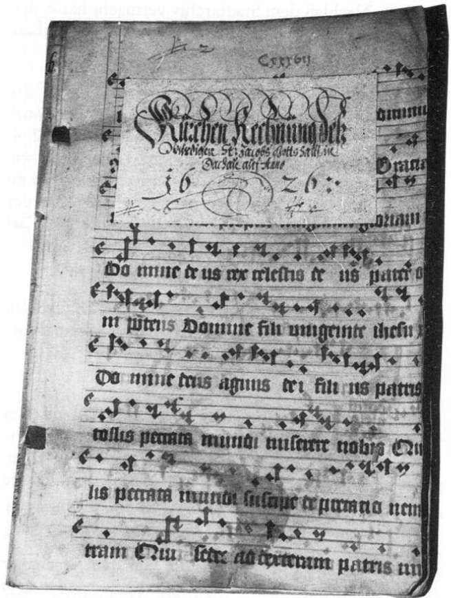
»Kirchen Rechnung des würdigen St. Jacobs Gottes Haus in Dachau auf Anno 1626.« Eines der ältesten Archivalen des Stadtarchivs Dachau, die Kirchenrechnung von 1626 mit einem Notenblatt des 14. Jhs.