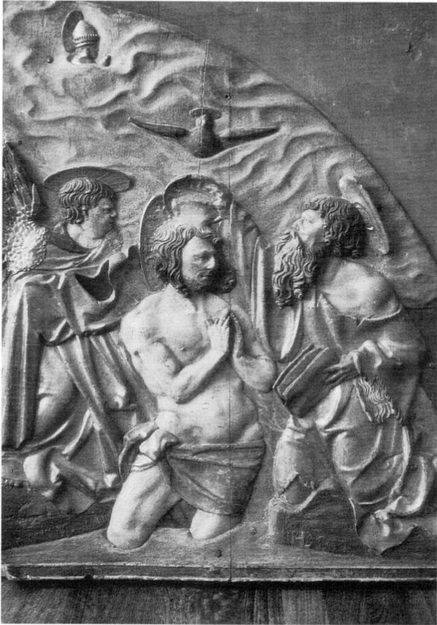
»Taufe Christi«, Hans Leinberger schuf das Werk um 1515.

vorgestellt. Die Fotoskizze zeigt in der Mitte eine Rundbogennische mit dem sitzenden Johannes, wie er mit der Rechten auf das Lamm, das auf dem Evangeliumsbuch liegt, deutet, gemäß der Schrift: »Ecce Agnus Dei ...« Die Figur ist in Komposition und Gestaltung dem hl. Jodokus (Bayer. Nationalmuseum München) Hans Leinbergers von 1525 nachempfunden. In der Nische der Predella wird das Haupt des Heiligen in einer Schüssel liegend angenommen. Die geöffneten Flügeltüren erzählen im Relief vier Szenen aus dem Leben des hl. Johannes: links oben die Taufe, darunter Besuch im Gefängnis, rechts oben die Predigt in der Wüste, unten die Enthauptung.