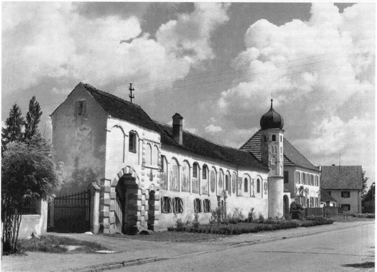
Torbau, Schloßkapelle, Turm und Benefiziatenhaus.