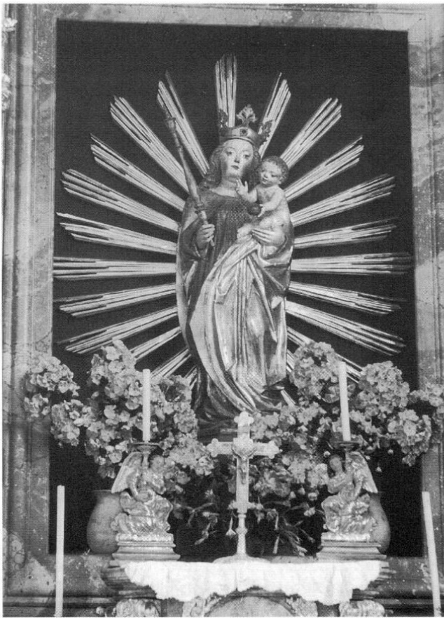
Gotische Marienfigur vom Hochaltar.