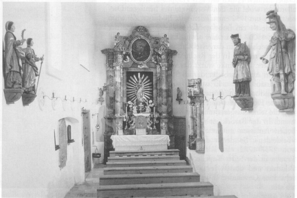
Innenraum der Schloßkapelle.