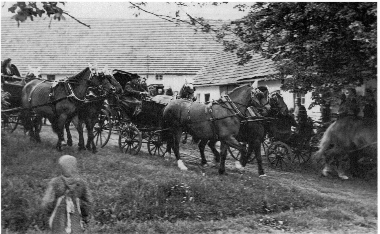
Die Chaisens des Hochzeitszuges fahren beim »Josl« zu Humersberg (Gde. Altomünster) an, 1949.