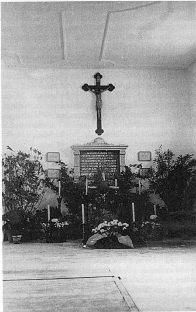
Gedenktafel in der katholischen Kirche von Gröbenzell (aufgenommen am Heldengedenktag 1942).

Die katholische Kirchenverwaltung beauftragte ihr Mitglied, den Bildhauer Rummer, von dem bereits die Altäre, Kanzel, Beicht- und Kirchenstühle in der Kirche stammten, 8 eine endgültige Form für die Tafel zu gestalten, die er aus Marmor mit einem Kalksteinrahmen bildete.