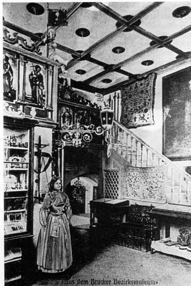
Ein wichtiger Beleg war das Foto aus dem aufgelösten Brucker Museum, auf dem links oben zwei Tafeln zu erkennen sind.