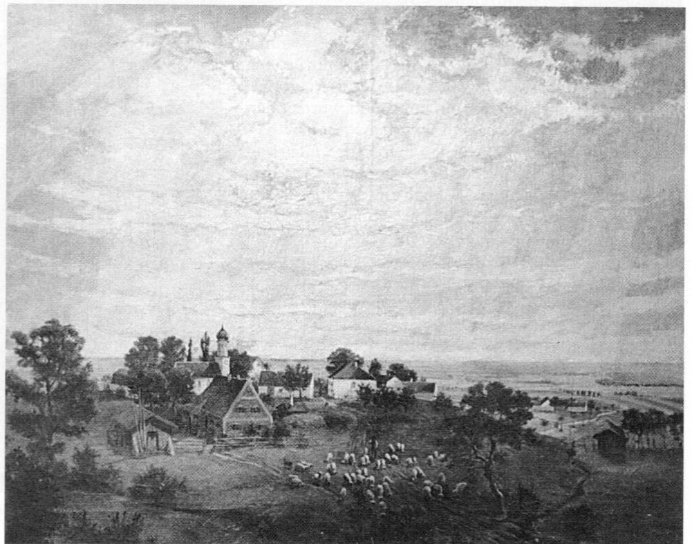
Carl Olof Petersen: Bauernland , Öl/Leinwand, 80 x 100 cm, 1937.