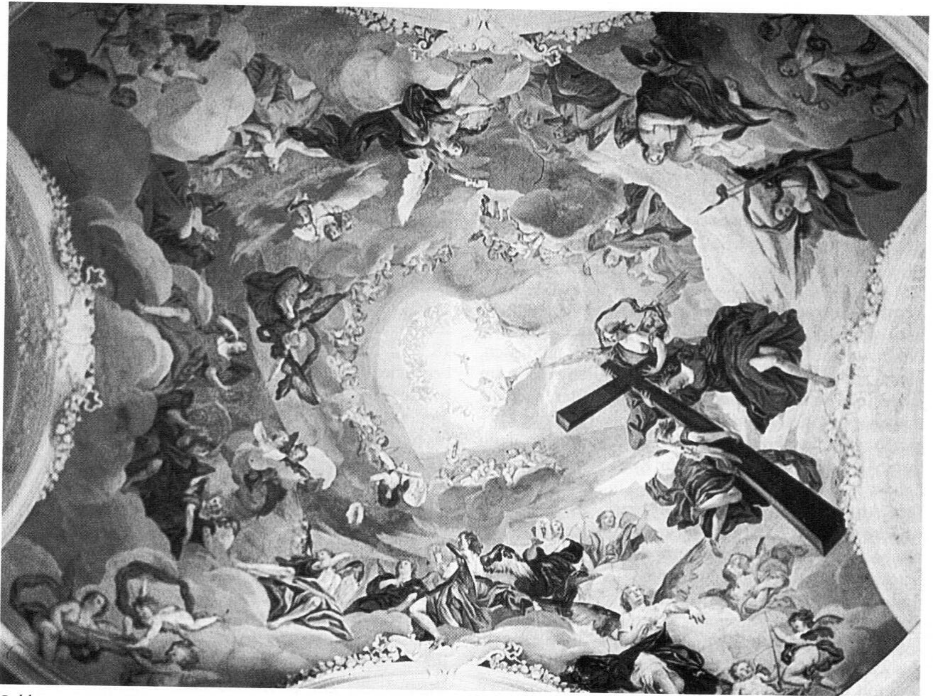
Balthasar August Albrecht: Kuppelfresko in der ehemaligen Hofmarkskirche Schönbrunn.