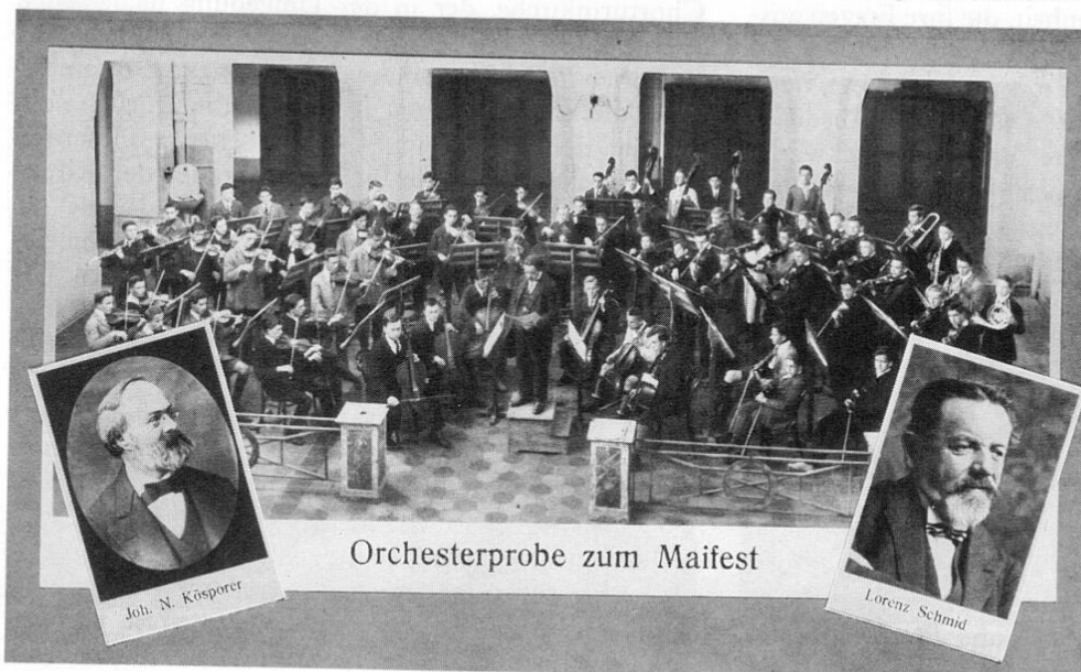
Orchesterprobe zum Maifest