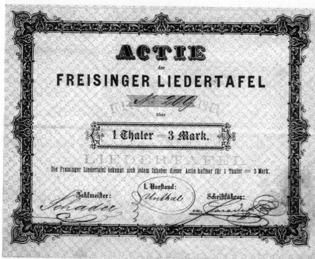
Aktie der Freisinger Liedertafel über 1 Thaler = 3 Mark zur Finanzierung eines neuen Flügels, 1874.

Die Auswahl der Lokalitäten für die Zusammenkünfte der Liedertafel in Freising war nicht immer einfach und