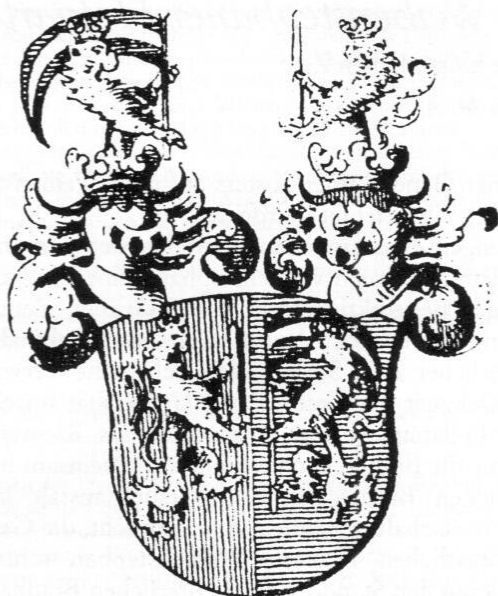
Aus Siebmachers großes Wappenbuch, Bd. 22/VI/1.