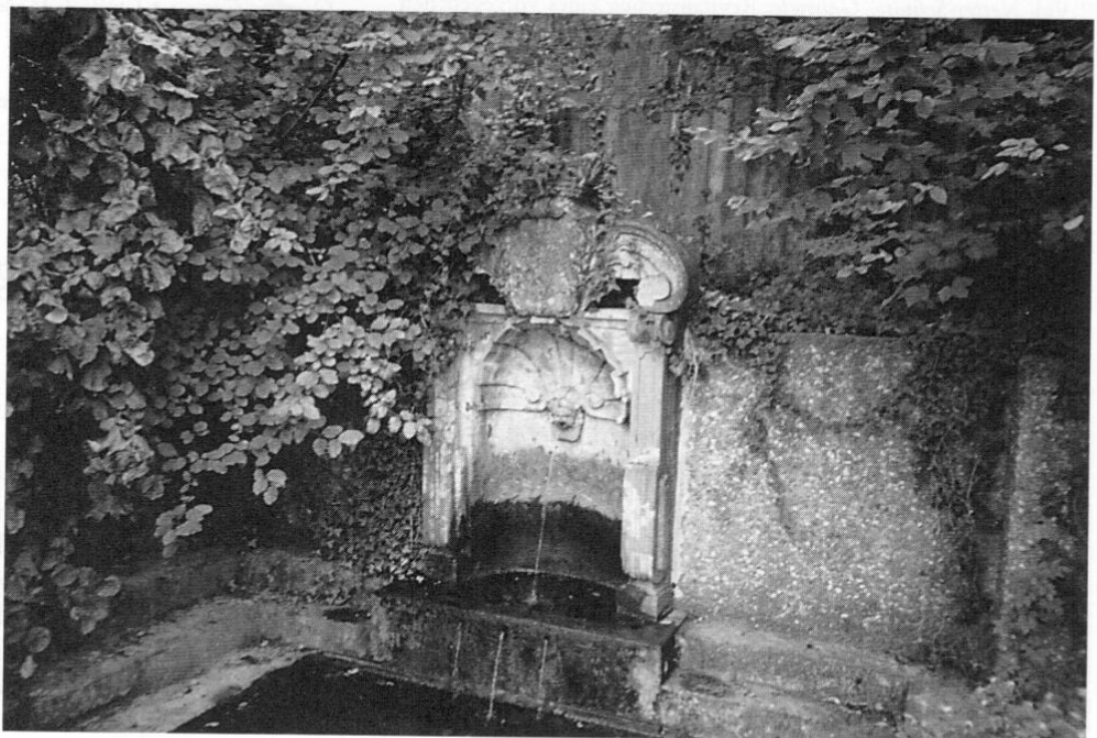
Der Muschelbrunnen im Weihenstephaner Hofgarten.

Als Blickfang bereichert heute der barocke Marmor-