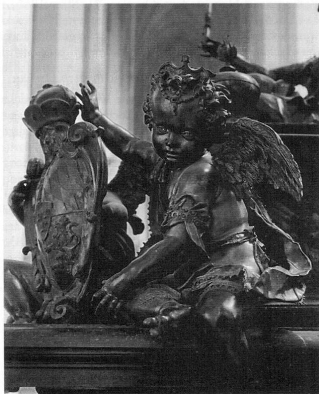
Putto am Grabmonument Kaiser Ludwigs des Bayern.

Am Allerheiligenfest 1997 ist der weithin geschätzte, in Dachau ansässige Kunst- und Architekturfotograf Wolf-Christian von der Mülbe kurz nach Vollendung