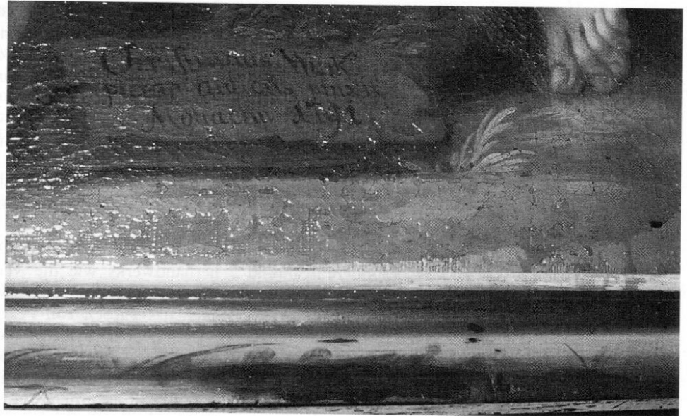
Rechter unterer Rand der Franziskustafel in St. Kastulus zu Moosburg mit der Signierung: »Christian Wink pictor aulicus pinxit Monachii 1791«.

reiche Symbolismus dient der Vielfalt der barocken Ausdrucksformen. Während die oberen Engel in der Lichtkrone die Haupthandlung aufmerksam und einfühlend begleiten, fällt beim untersten Engel auf, daß er sich nicht am zentralen Geschehen beteiligt. In einer betonten Posehaltung wirft er den Blick auf den Betrachter und will ihn gleichsam einladen zum Verweilen, zum Schauen und Fühlen, um dann »mit dem Wort zur vollen Erkenntnis zu gelangen«.