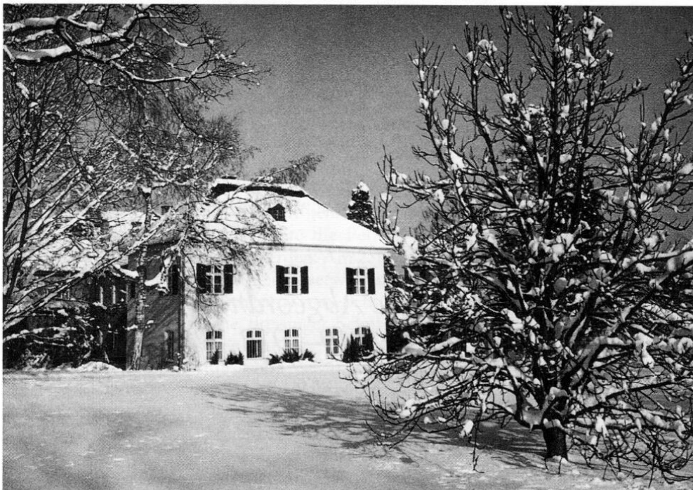
Das Salettl mit den Anbauten von 1866 und 1896.