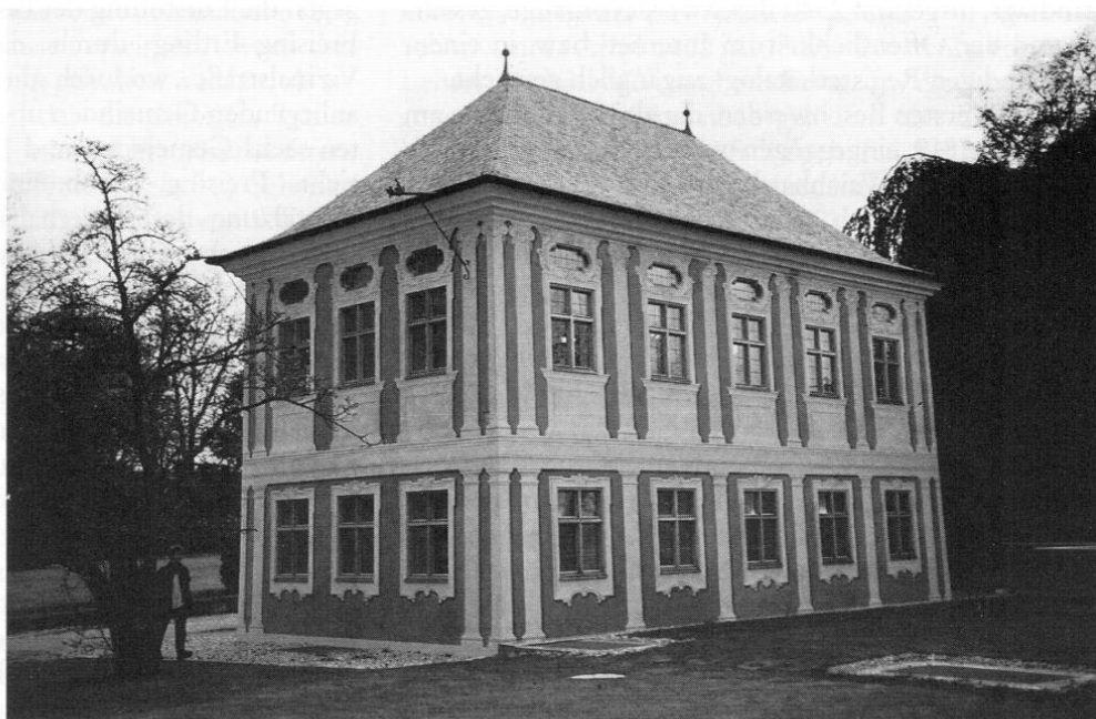
Das Salettl nach der Renovierung von 1996/97.

Der örtliche Kristallisationspunkt all dieser Vorgänge war das Salettl, das nach- und nebeneinander als Lagerstätte für Obst- und Gartenerzeugnisse, Personalwohnung, Schule, Internat und Direktorat diente. In dem nunmehr wieder so erstaunlich und erfreulich ins Licht gehobenem Gebäude wird mit Recht die Keimzelle der Fachhochschule Weihenstephan gesehen.