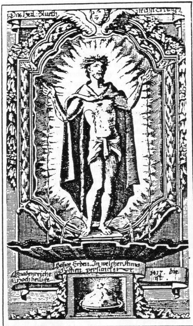
Abb. 4: Gnadenbild von Hl. Blut in Altenerding. Das Bild zeigt einen dornengekrönten Fünf-Wunden-Christus, dessen herabfließendes Blut in einer Muschelschale zusammenströmt. Unten in der Mitte einen Schale mit Erdreich.

Bei diesen genannten fünf Kreuzgängen (mit Ausnahme von Rudlfing) wurde auf dem Rückweg nicht mehr gebetet. Die Wegstrecke reichte auch so gut für drei Rosenkränze aus. Nach dem Gottesdienst wurde nur noch aus dem Dorf hinaus gebetet, dann löste sich der Kreuzgang auf. Aber auch dieses Hinausbeten hat man letztlich wegfallen lassen. In Neufahrn war dies 1770 schon nicht mehr der Fall.