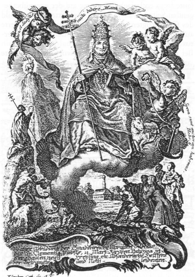
Abb. 5: St. Klemens in Oberberghausen. Aus: Peter Steiner: Gnadenstätten zwischen München und Landshut. München 1979.

Im Verhältnis zu den Kreuzgängen war die Zahl der (eucharistischen) Prozessionen gering. Eigentlich könnten hier nur die Prozessionen in der Fronleichnamszeit angeführt werden, wenn in der Pfarrei Weihenstephan-Vötting nicht eine Besonderheit zu verzeichnen gewesen wäre. Die Kirche St. Jakob wurde zwar allgemein als Pfarrkirche bezeichnet, aber die eigentliche Pfarrkirche blieb auch nach ihrer Errichtung 1153 die Klosterkirche, in der auch der Pfarraltar (als solcher galt der Kreuzaltar) stand. Die Kirche St. Jakob hatte nur einen Taufstein. Das Sanctissimum wurde dort (ebenso wie die heiligen Öle) nicht aufbewahrt, sondern ausschließlich in der Klosterkirche. Dies brachte während des Jahres keine Probleme mit sich, weil die Gläubigen in damaliger Zeit ja nur an Ostern zur Kommunion gingen. Es mußte also an diesen Kommunionstagen – dies waren der Palmsonntag, der Gründonnerstag und der Ostersonntag – erst dorthin übertragen werden. Beim Palmsonntag ist vermerkt: »An diesem Palm Sonntag wird weg[en] der östl. hl. Communion das Sanctissimum in ciborio um