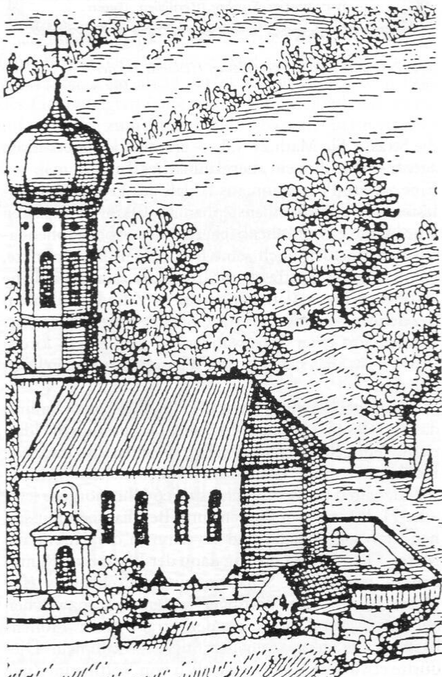
Abb. 8: Pfarrkirche St. Jakob. Vergrößerter Ausschnitt aus »Closter Weichen Stephan«, Stich von Michael Wening, 1701.

Ein weiterer solcher Festtag war der letzte Tag des Jahres, St. Silvester. Dieser Heilige wird ja auch heute noch als der zweite Patron der Kirche in Hohenbachern verehrt. Er gilt, wie auf dem Andachtsbild zu lesen ist, als »Ein Sonderbahrer fürbitter Wider Die gefährliche Sucht Under dem Viech«. Man ehrte ihn, wie auch an manchen anderen Orten, mit Gottesdiensten, Pferdeumritten und auch Pferderennen. Wann dieser Brauch entstanden ist, kann man nicht mehr eruieren, man weiß nur, daß es ihn schon immer gegeben hat. Nach den Eintragungen im Kalendarium stellt sich dieser Tag, der mit einem vollkommenen Ablass verbunden war, so dar: Von 5 Uhr bis 9 Uhr wurden Messen gelesen. Es kamen dazu außer dem Pfarrvikar auch andere Patres aus dem Kloster. Dem Pater Culinarius war dabei die Abwen-