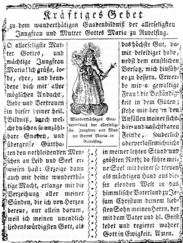
Abb. 2: Gnadenbild unserer lieben Frau von Rudelsfing. Aus: Peter Steiner: Gnadenstätten zwischen München und Landshut. München 1979.

waren ja den Naturgewalten ausgeliefert und konnten sich nicht – wie z. B. heute durch eine Hagelversicherung wenigstens finanziell – dagegen absichern. Der damals an sich schon spärliche Ertrag ihrer Felder war für sie lebensnotwendig. Auch sonst werden sie von Sorgen und Lasten nicht verschont gewesen sein. Krankheiten, Viehseuchen, Kriegswirren brachten weitere Unsicherheiten und Ängste. Bittgänge und Wallfahrten entsprangen für sie einem inneren Bedürfnis, beim Herrgott um gutes Wetter für die Feldfrüchte zu bitten, sowie um die Abwendung von Blitz und Ungewitter, von Pest, Hunger und Krieg, und dabei auch bestimmte Heilige als Fürsprecher und Helfer miteinzubeziehen. Freilich brachten sie auch eine willkommene Abwechslung, boten die Möglichkeit, aus ihrer passiven Rolle, zu der sie sonst bei den Gottesdiensten verurteilt waren, herauszutreten, sich aktiv zu betätigen, den eigenen engen Umkreis zu durchbrechen und Neues kennenzulernen. Aber alles, was sie im Leben bedrückte, haben sie bei diesen Kreuzgängen als ihr »Kreuz« mitgetragen.