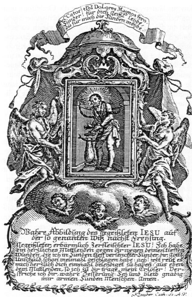
Abb. 7: Gnadenbild des gegeißelten Heilands auf der Wies bei Freising.

Die Fronleichnamsprozession wurde in Hohenbachern jeweils am Sonntag nach Fronleichnam begangen. Sie gestaltete sich etwas einfacher als in Weihenstephan, weil die Kirche einen Tabernakel hatte, in dem das Allerheiligste aufbewahrt wurde. In einem Vermerk für die vorausgehende Woche wird daran erinnert: »Diese Wochen soll zu Hohen Pachern eine grosse Hostia consecrirt werden, weilen am künftigen Sonntag all-dort die 4 hl. Evangelia müssen gehalten werden.« Der Gottesdienst begann um 5 Uhr mit der Prozession mit dem Sanctissimum »um den Freythoff« mit den genannten vier Stationen. Nach der Rückkehr in die Kirche wurde »exposito Sanctissimo die hl. Messe gesungen, zuletzt das Sanctissimum wiederum in den Tabernacl reingesezt und der Weybrunn ausgegeben«. Es ist dabei auch von einem Brauch die Rede, »die gemachten Cränzlein an der Monstranzen anzureichern«. Der Schreiber des Kalendariums, P. Maurus Fischer, verurteilt dies als einen »superstitiosen Mißbrauch« (= abergläubisch) und meint, dies »soll gänzlich ausgelassen werden«. Sein Mitbruder und Nachfolger als Pfarrvikar P. Gregor Heigl weist ihn aber brüderlich zurecht und schreibt später dazu: »Quare superstitiose? Reverende P. Maure!« (Weshalb abergläubisch? Verehrter P. Maurus!) »eine große Menge Volkes breitete ihre Kleider auf den Weg. Einige hieben Zweige von den Bäumen ab, und streuten sie auf