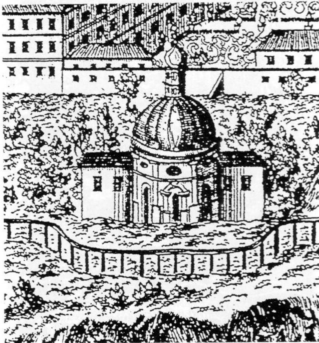
Abb. 6: St. Korbinian. Kirche am Südhang des Weihenstephaner Berges. Vergrößerter Ausschnitt aus: Kloster Weihen Stephan. Stich von Joseph Anton Zimmermann in Monumenta Boica , Bd. IX, 1767.

Bei dem Bild des Gekreuzigten, vor dem das dritte