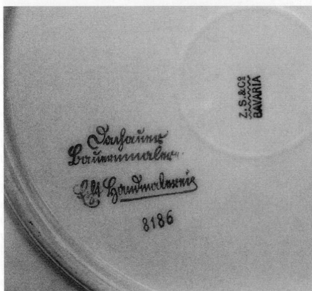
Porzellanmarke auf dem Kaffeeservice »Dachauer Bauernmalerei – Echt Handmalerei« aus dem Jahre 1920.

Es bleibt noch festzustellen ob und gegebenenfalls in welchem Zusammenhang diese sogenannte »Dachauer Bauernmalerei« mit Dachau steht. Denkbar wäre zum Beispiel, daß ein in Dachau wirkender Künstler, der