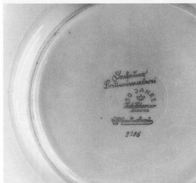
Porzellanmarke auf dem Kaffeeservice »Dachauer Bauernmalerei – Echt Handmalerei« aus dem Jahre 1930.