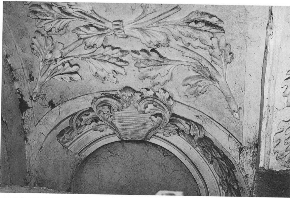
St. Peter und Paul in Neustift: Überkreuzte, durch einen Ring in der Mitte verbundene Akanthuszweige als Gewöl- bestück, darunter Abschluß einer Nische.