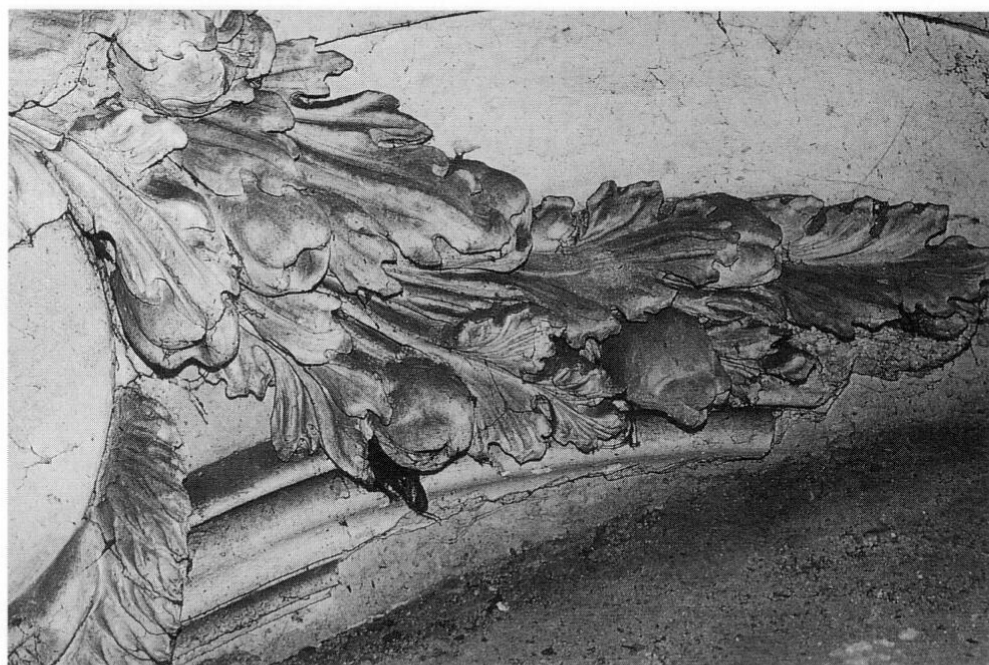
St. Peter und Paul in Neustift: Teil einer Fruchtgirlande über einem Fenster.