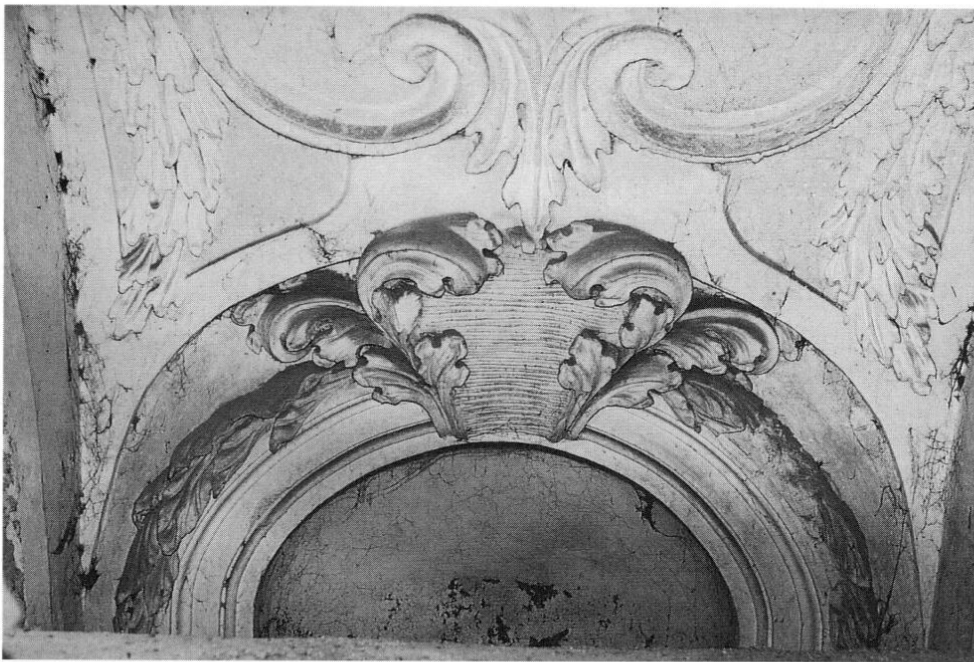
St. Peter und Paul in Neustift: Nische an der Schmalseite einer Kapelle (ca. 50 cm tief, ca. 115 cm breit), unmittelbar unter dem Gewölbeansatz. Akanthusblatt als Dekorationsmotiv vorherrschend.