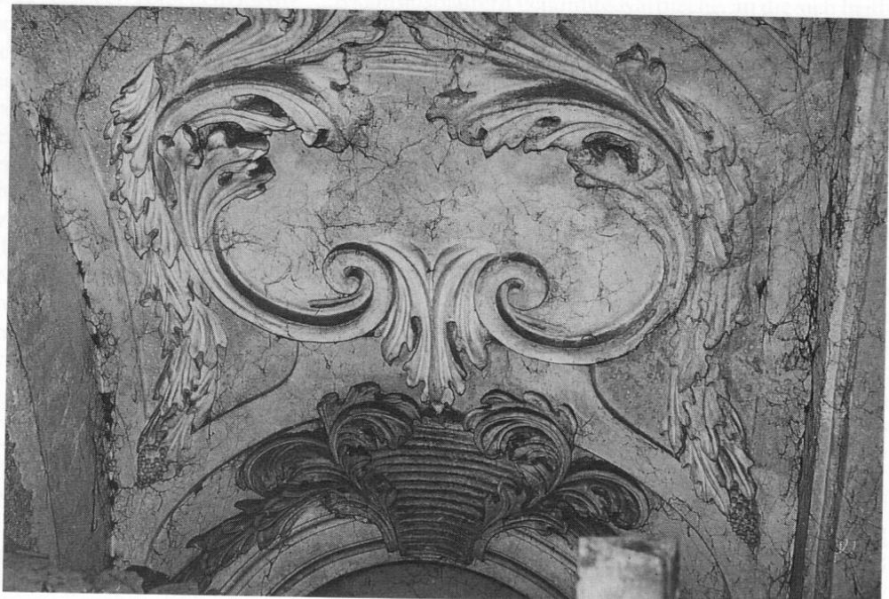
St. Peter und Paul in Neustift: Schwungvoll modellierter C-Bogen als Gewölbestück, in Akanthusblätter auslau- fend, darunter Abschluß einer Nische.