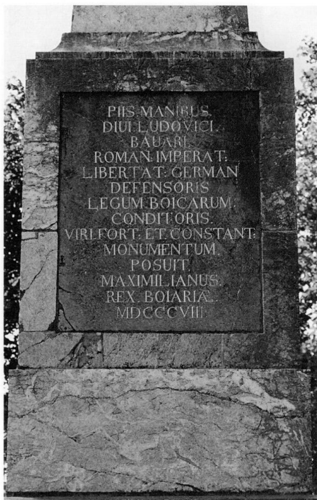
Die lateinische Inschrift auf der Kaisersäule in Puch nach der Restaurierung.

Monumenta Bavaria 1987. Hrsg. vom Bayerischen Landesamt für Denkmalpflege.