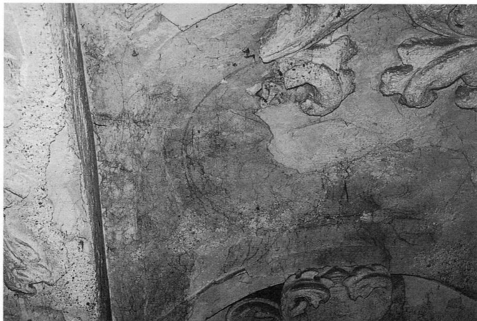
St. Peter und Paul in Neustift: Nach dem Abfallen der Stukkatur ist die deutliche Vorzeichnung des Stukkators zu sehen.