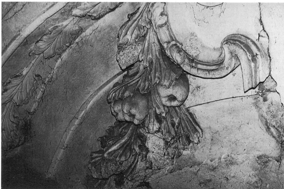
St. Peter und Paul in Neustift: Sehr plastische Fruchtgirlande als Teil einer Fensterbe- krönung links in der Bogen- laibung doppelt gelegtes Blattwerk.