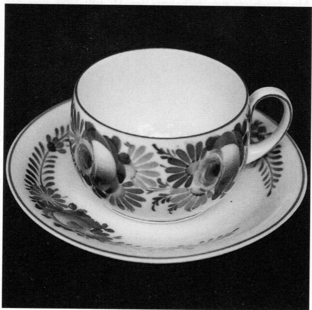
Tasse mit Untertasse des Kaffeeservices »Dachauer Bauernmalerei – Echt Handmalerei« aus dem Jahre 1920.