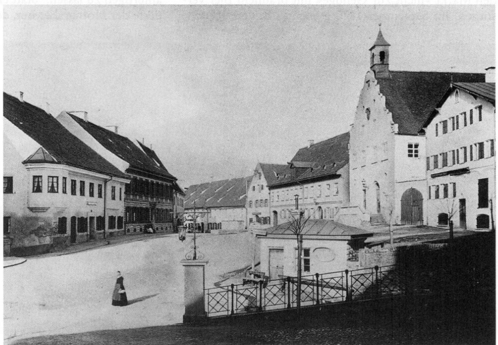
Der Dachauer Marktplatz um 1890. Links die beiden alten Weintafernwirtschaften, hinter dem Rathaus die Brauerei Zieglerbräu.