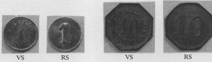
Schlüter Messinggeld 1916/17