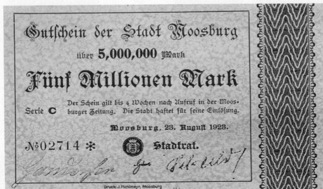
Stadt Moosburg, Notgeld über 5 Millionen Mark, 85 × 136 mm.

Rückseitenansichten, Amper-, Isar- und Münchner Tor, Ausgabe 1. Feb. 1921) gedruckt und ausgegeben. Das Tonwerk Moosburg, A. & M. Osterrieder, heute Südchemie, hat Kleingeldmünzen aus Zink (5 Pfg., 10 Pfg. und 50 Pfg.) prägen lassen, ebenso der Staudingerbräu