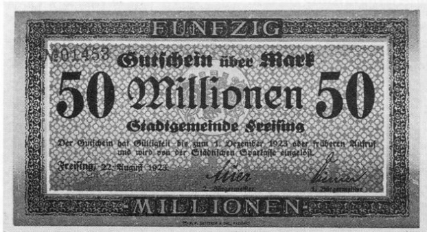
Stadt Freising, Notgeld über 50 Millionen Mark, 84 × 150 mm.

mehr mit dem Drucken der Inflationsscheine nachkommen und dadurch eine Papiergeldknappheit herrschte, wurden auch von der Stadt Freising, der Stadt Moosburg und von verschiedenen Firmen und Banken kurzfristig Notgeldscheine und Werkschecks als Zahlungsmittel gedruckt und ausgegeben. Im Freisinger Tagblatt finden sich hierzu folgende interessante Hinweise: