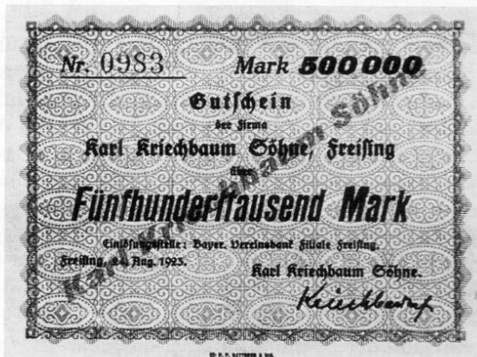
Firma Karl Kriechbaum Söhne, Freising, Notgeld über 500000 Mark, 76 x 139 mm.