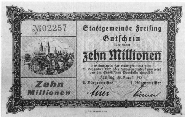
Stadt Freising, Notgeld über 10 Millionen Mark, 84 × 128 mm.