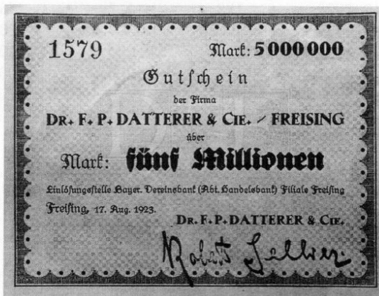
Firma Dr. F. P. Datterer u. Cie., Freising, Notgeld über fünf Millionen Mark, 92 x 119 mm.