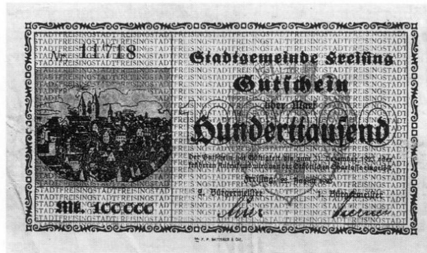
Stadt Freising, Notgeld über 100000 Mark, 87 × 150 mm.