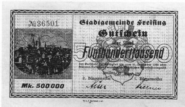
Stadt Freising, Notgeld über 500000 Mark, 90 × 150 mm.