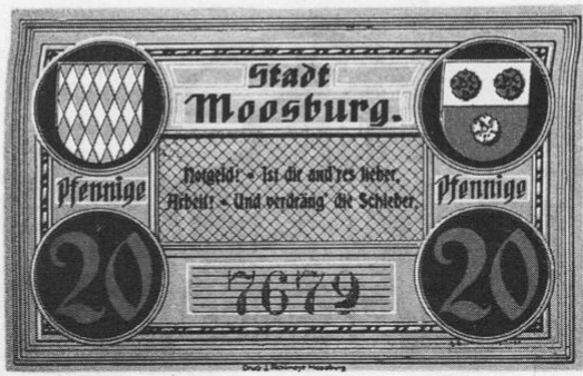
Stadt Moosburg, Notgeld über 20 Pfg., 53 × 84 mm.