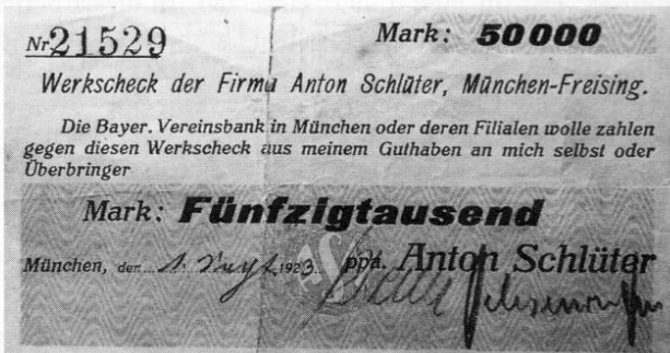
Firma Anton Schlüter, München-Freising, Notgeld über 50000 Mark, 76 x 139 mm.