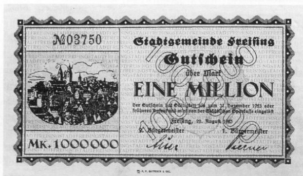
Stadt Freising, Notgeld über eine Million Mark, 88 × 149 mm.