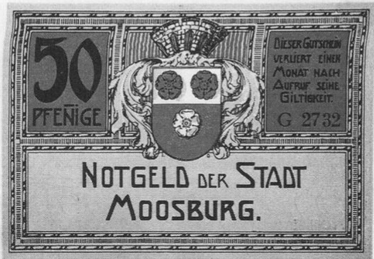
Stadt Moosburg, Notgeld über 50 Pfg., 67 × 100 mm.