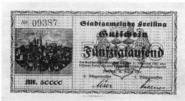
Stadt Freising, Notgeld über 50000 Mark, 87 × 150 mm.