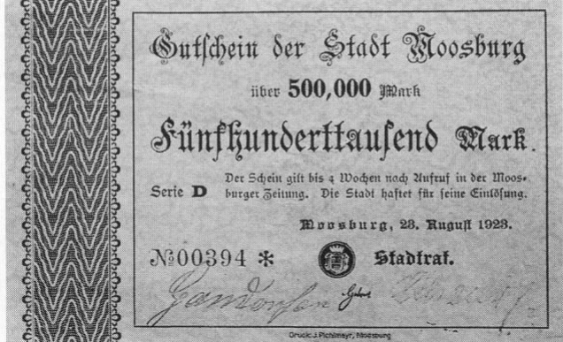
Stadt Moosburg, Notgeld über 500000 Mark, 85 × 136 mm.