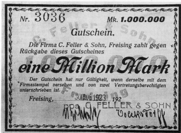
Firma C. Feller u. Sohn, Freising, Notgeld über eine Million Mark, 92 x 117 mm.