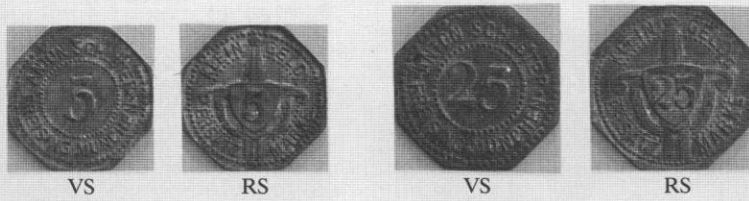
Schlüter Zink-Kriegsnotgeld 1. 4. 1917-1. 5. 1918