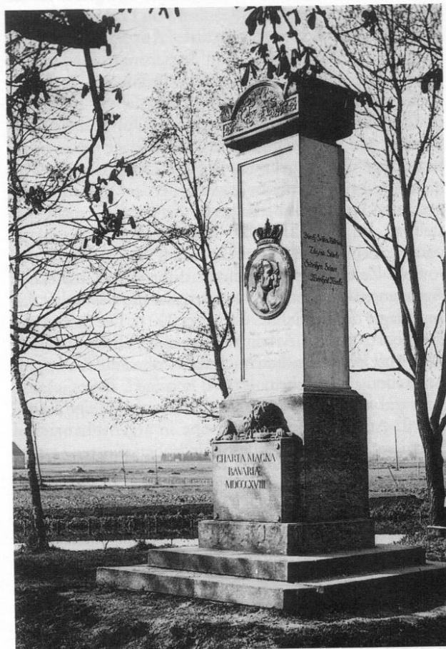
Der Königsstein um 1900.

einem Festschießen auf der Schießstätte nachmittags eröffnet. Den Abend krönten die Benefizaufführung »Eduard von Holland« im Gesellschaftstheater und ein von der Landwehrmusik veranstalteter Fackelzug. Der eigentliche Festtag am 16. Februar begann um 5.30