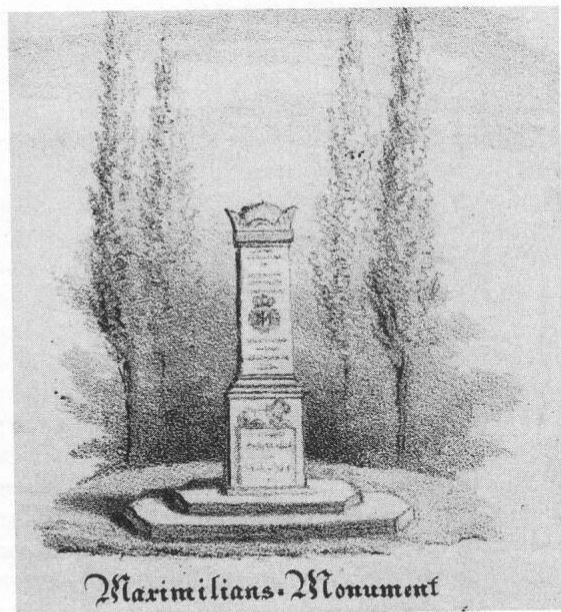
Auf einer mehrteiligen Lithographie mit Darstellungen Freisinger Sehenswürdigkeiten um 1840 findet sich unten in der Mitte eine Abbildung des Denkmals, die den ursprünglichen Standort im Schulgarten mit den umgebenden Pappeln wiedergibt.

Die Kosten der Transferierung wurden zur Hälfte mit 100 fl vom Verschönerungsvereine übernommen, circa 100 fl gingen durch eine Sammlung freiwilliger Beträge