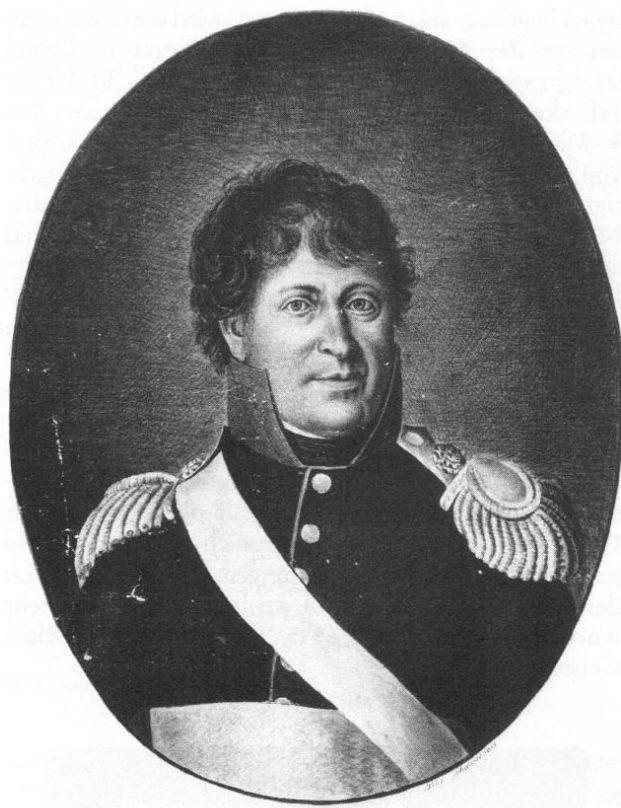
Abb 2: Peter Schwimmer: Kopie des Heiglporträts von Ignaz Frey, 1815. Feder in Schwarz, 39 × 28,5 cm (Blattgröße). Museum des Hist. Vereins Freising, Inv.-Nr. 0033.

5 gleich breite Streifen in den Landesfarben, und zwar in der Abfolge blau – weiß – blau – weiß – blau. Bei genauer Beobachtung sieht man, daß es Ignaz Frey im Gemälde nicht ganz genau genommen und den Streifen zwei weitere hinzugefügt hat. 24