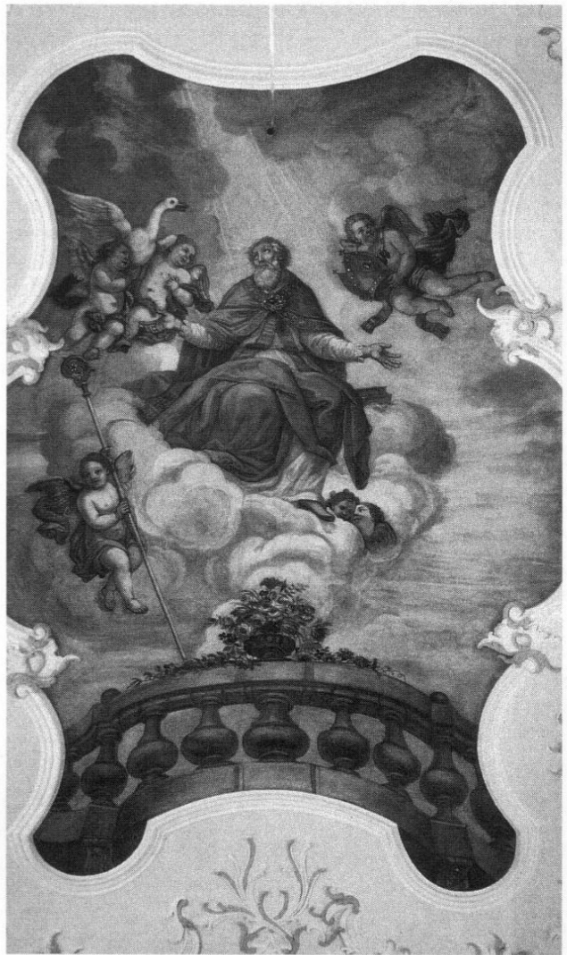
Abb. 5: Freisinger Künstler des Barock und Rokoko: Joseph Unterleutner. Hl. Martin in der Glorie. Deckenbild im Chor der Niederding Kirche, um 1761.

Eine neue Qualität der Kunstschreinerarbeit ab den 1750er Jahren, die mit dem Namen Fackler verbunden ist, führte zu elegant beschwingten Kircheneinrichtungen voller Esprit, die besser als jene nach Plänen Jorhans