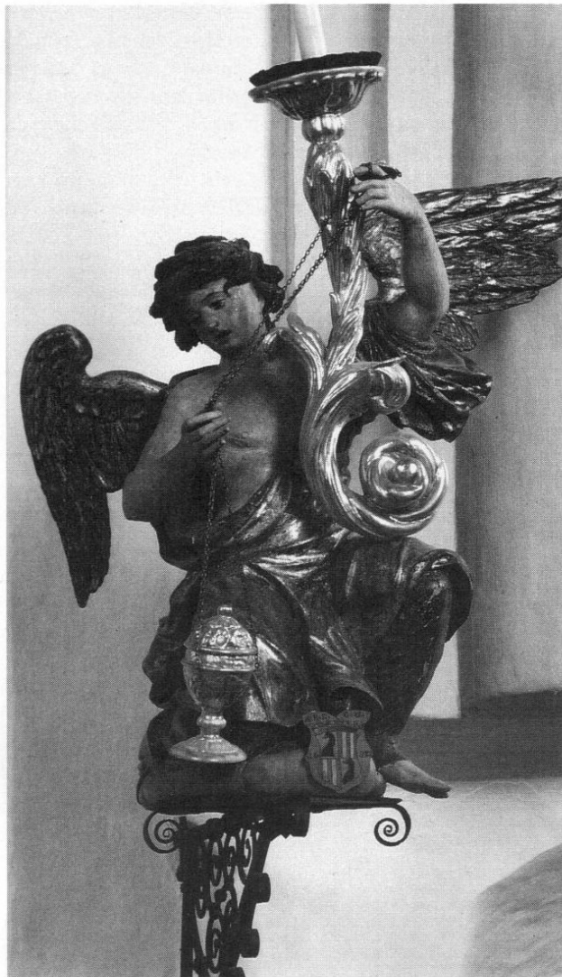
Abb. 1: Freisinger Künstler des Barock und Rokoko: Johann Christoph Thalhammer. Leuchterengel in Johannrettenbach, 1683.

Frau Ammer verließ ihrer Hoffnung Ausdruck, Hoheit werde wegen der von purem Neid getriebenen Freisinger Meister das Vorhaben nicht einzustellen gedenken,