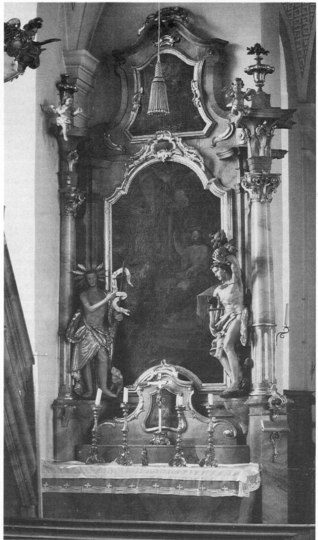
Abb. 7: Freisinger Künstler des Barock und Rokoko: Joseph Angerer und Franz Anton Schäffel. Skulpturen und architektonischer Aufbau, linker Seitenaltar in Oberding, 1775/76.