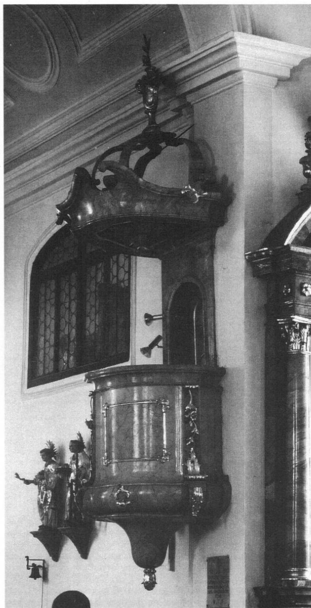
Abb. 8: Freisinger Künstler des Barock und Rokoko: Matthias Fackler d. J. Kanzel in Kranzberg, 1781.

34 Möglicherweise das erste Mal seit dem frühen 16. Jh. Zu berücksichtigen ist, daß der nordöstliche Teil des Pfliegergerichts vor den Toren Landshuts, der heute in Niederbayern liegt, kunsttopographisch ein gewisses Sonderdasein führte und stets in geringerem Maß nach Erding orientiert war. Andererseits gab es teilweise enge Beziehungen zum jetzt dem Landkreis Erding angehörenden Dorfener Gebiet. Die Tätigkeit des Schreiners Fackler im Erdinger Gericht