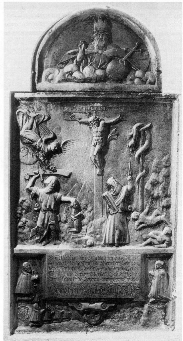
Freising, Pfarrkirche St. Georg, Grabplatte für Georg Thaimer (1592). Inschriftenkommission München H. S. XIV/26 a.