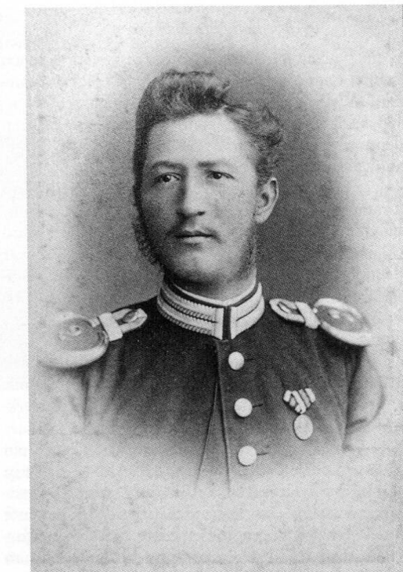
Gustav Medicus (1821–1883), der Gründer der München-Dachauer Aktiengesellschaft für Maschinenpapierfabrikation als Hauptmann de La suite.

2 StadtADah Magistratsprotokoll v. 11. 3. 1840 S. 31.