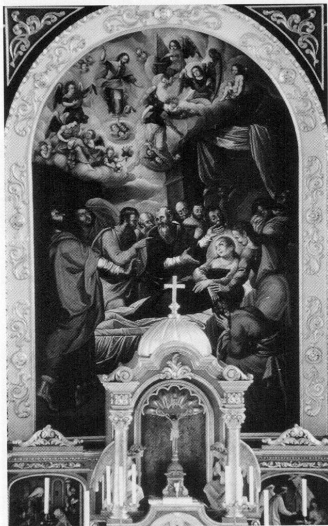
Johann Miller, Altarblatt des Hochaltars in Hochburg/OÖ., »Tod Ma- riens« von 1657.