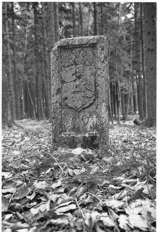
Abb. 5: Der Dreierherrenstein im Hammerwald bei Türkenfeld von 1692.