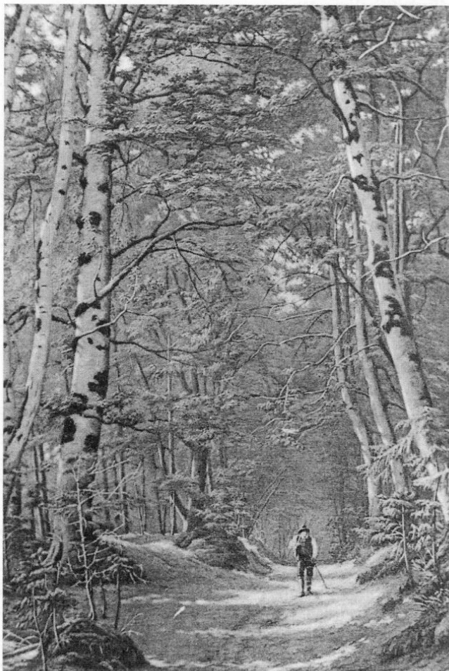
Abb. 4: Waldstück bei Schöngeising um 1895. Bildpostkarte. Repro: Verfasser

Die letzten Worte des Brentanhiasl (nach dem Hausnamen »beim Brentan«, seines Geburtshauses in Kissing) waren in die Zukunft gerichtet: »Dem Menschen ist es gesetzt zu sterben, und auch von denen, die mich gerichtet haben, wird in fünfzig Jahren gewiß keiner mehr am Leben sein (»In fufzg Jahr seid's ös aa hi!«) 25 Nicht ahnen konnte Hiasl wohl, in welchem Ausmaß seine Rolle als Volksheld und »gerechter Räuber« in der Nachwelt erhalten bleiben und quasi fortgeschrieben werden sollte.