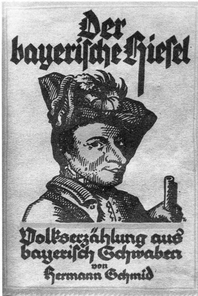
Abb. 1: Titelblatt einer 1922 in Dillingen erschienenen Biographie des Bayerischen Hiasl.