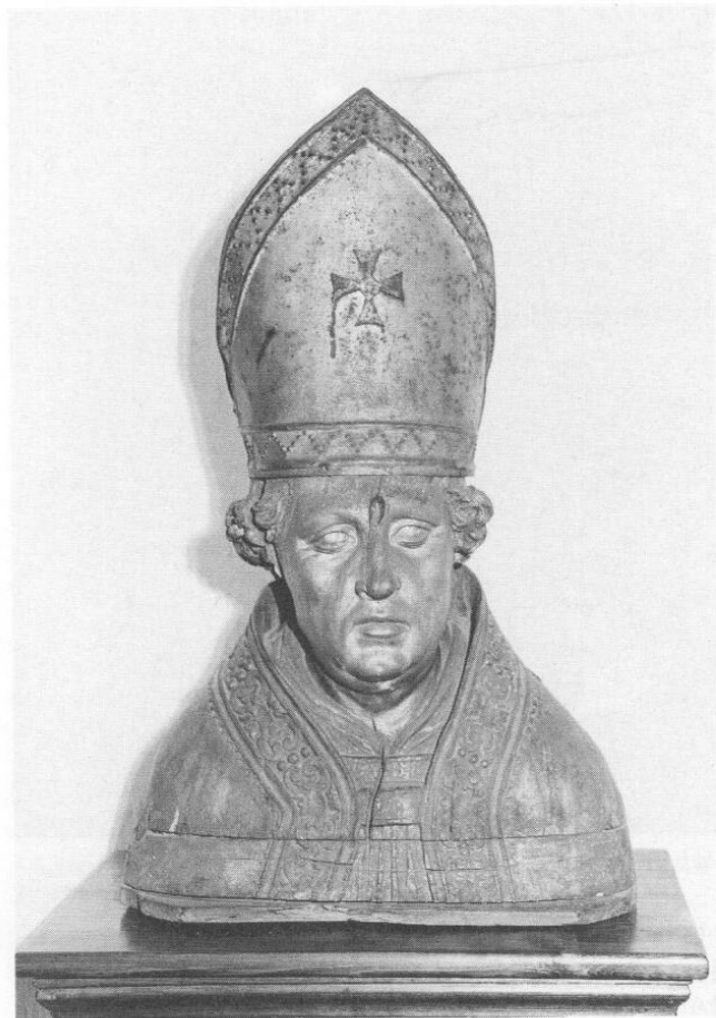
Abb. 2: Altomünster, um 1730, möglicherweise ein Werk des Laienbruders Nonnosus Specht.