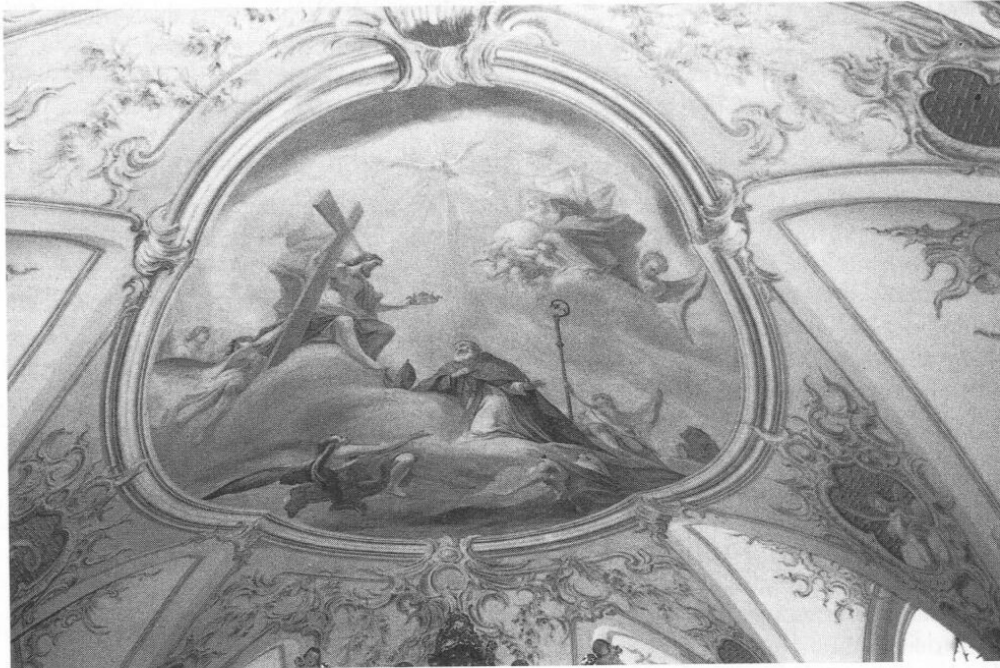
Johann Georg Dieffenbrunner, Fresko im Chorraum der Pfarr- kirche St. Korbilian in Westerholzhausen mit der Darstellung der Aufnahme des hl. Korbilian in den Himmel.