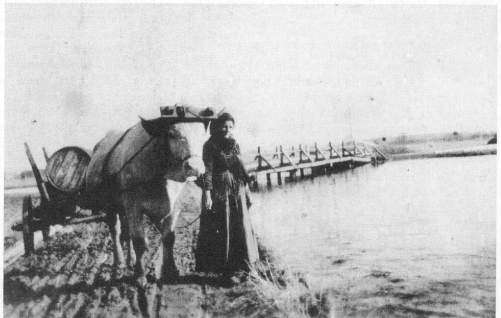
Vötting, untere Brücke vor 1932 mit Mühlenweg bei der ehemaligen Vöttinger Mühle.

Es kam noch hinzu, daß die Brücke nicht mehr nur für den landwirtschaftlichen Verkehr benutzt wurde. Im Neuland wurde ein Baugebiet für eine Siedlung erschlossen, an der von der »Feldfahrt« abzweigenden Straße