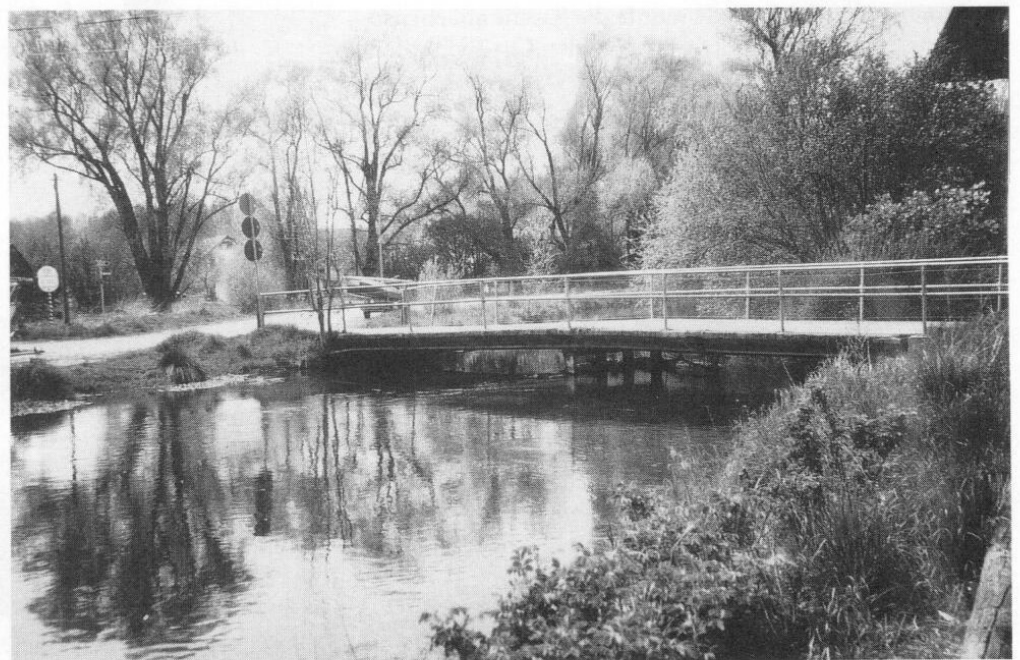
Vötting, obere Brücke, Bachstraße im Zustand bis 1994.

Neben dem Etat für die Gesamtgemeinde gab es damals für die Ortsgemeinde einen eigenen Haushalt. Die Dorf- bewohner wurden dabei durch die Ortsumlage zur Kasse gebeten. Sie entrichteten also durch diese Umlage auch ihren Beitrag zur Kostendeckung für die Brücke. Nun waren aber inzwischen von den mit der Brücke erschlossenen Gründen mehrere an andere Besitzer übergegangen, darunter auch an auswärtige, wie z. B. solchen aus Freising. Diese konnten durch die Ortsum- lage nicht erfaßt werden, sie hätten also zur Finanzierung nichts beigetragen. Das durfte natürlich nicht sein, und so beschloß der Ortsgemeindeausschuß ebenfalls am 25. Januar 1903: »Die auswärtigen Grundbesitzer, wel- che die neue Brücke benützen müssen, haben, da sie sonst zu den Kosten nichts beitragen würden, in der