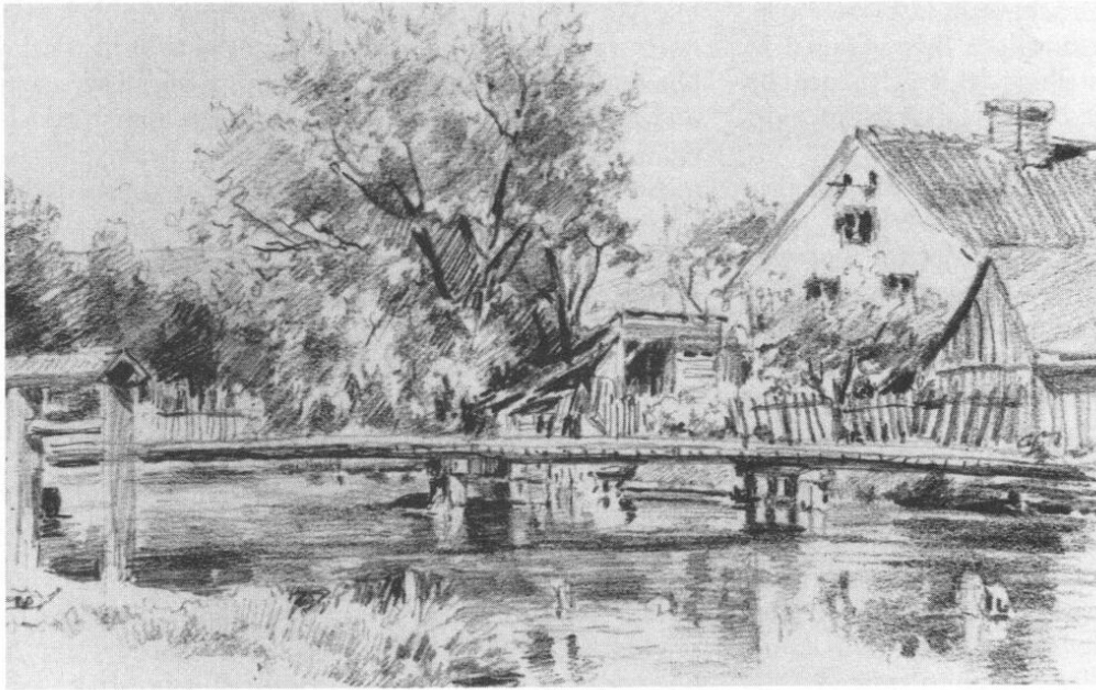
Vötting, obere Brücke, Bachstraße im Jahre 1901. Blei- stiftzeichnung von unbekannt.

gefaßt: »Die hölzerne Brücke über die Moosach bei dem Anwesen des Schreiners Schollweck, deren Instandhaltung unverhältnismäßig hohe Kosten erfordert, wird durch eine eiserne ersetzt.«