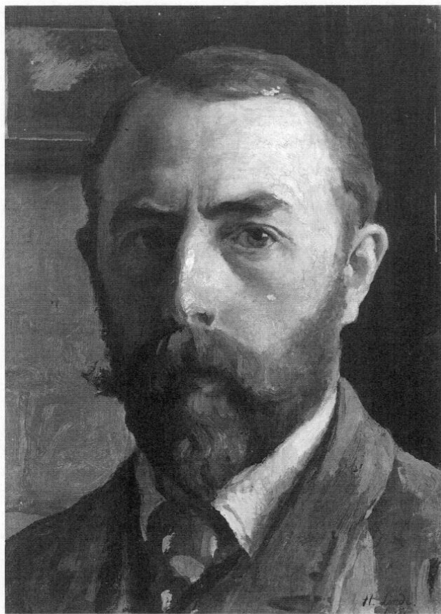
Hermann Linde (1863–1923), Selbstporträt, 1905, Öl auf Pappe, 36 x 25,5 cm.

Alle Figuren sind in kleinen oder originalgroßen Zeichnungen vorgearbeitet, manche in sehr zahlreichen. Da geht es zum Beispiel bei einer segnenden Gestalt darum, wie hoch sie den Arm erhebt, wie die Fingerhaltung ist, was der zweite Arm tut, wie die Fußstellung ist. Für jedes dieser Probleme gibt es gesonderte Vorzeichnungen, die verbessert, verändert, neu geschaffen werden, zuerst in kleinen, dann in großen Formaten, bis Linde mit der Lösung einverstanden sein kann. Hat er die endgültige Lösung gefunden, dann wird sie proportionsmäßig exakt, aber in freierer Form in die Farbe übertragen. In den Ansprachen nach Lindes Tod sagte Steiner, daß Linde als Maler an sich selbst Ansprüche gestellt hat, wie sie niemand anderes gestellt hätte. Auch bei diesen Motiven, die mehrheitlich in einer jenseitigen Welt spielen, wird überwiegend der Aufbau Vordergrund – Mittelgrund – Hintergrund und die Dreiteilung Zentrum, Seiten beibehalten.