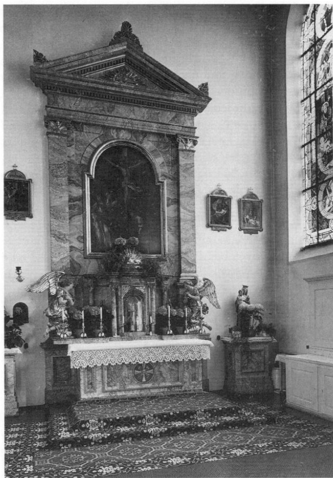
Altar der Krankenhauskapelle, 1925 durch den Kunstmaler Nickel renoviert.

zirk 1 Chirurg, 3 Bader n. O., 12 Hebammen, 2 Dispensir-Anstalten und 1 Distriktskrankenhaus. 54