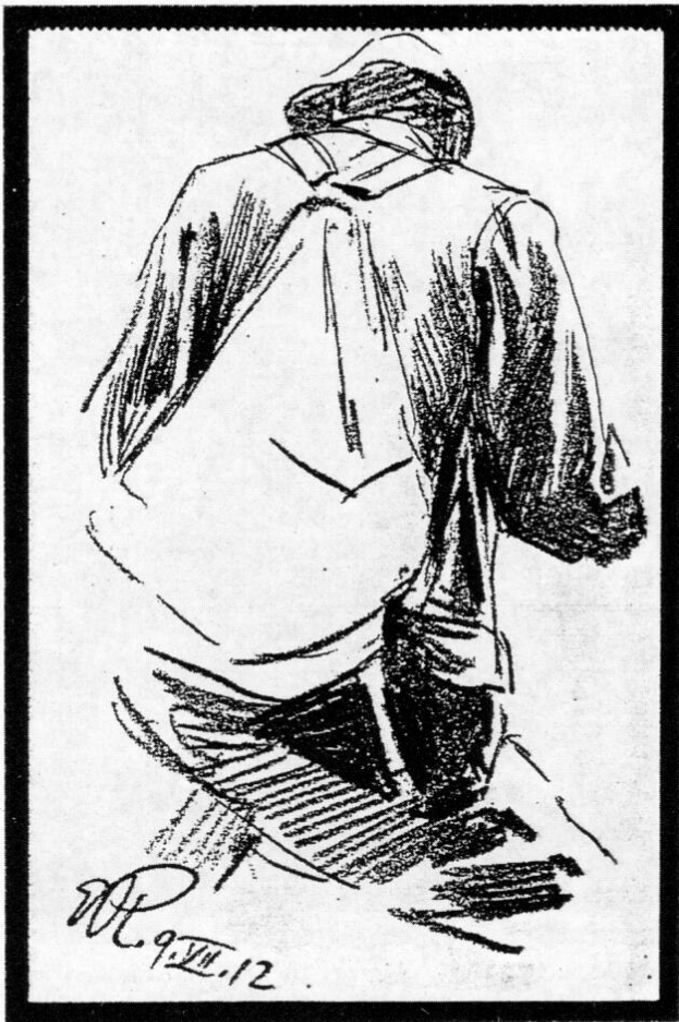
Bergsteiger. Zeichnung von Ernst Platz 1912.