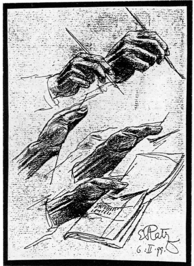
Schreibende Hände. Studie von Ernst Platz 1899.