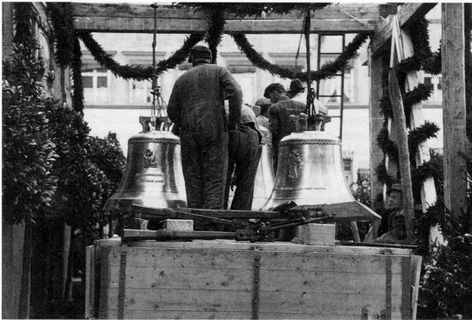
Abb. 2: Die am 21. Dezember 1948 für die Pfarrkirche St. Magdalena in Fürstenfeldbruck geweihten neuen Glocken. Links die Magdalenglocke (gis), daneben die Marienglocke (fis), dahinter eine der beiden großen Glocken (cis oder e).