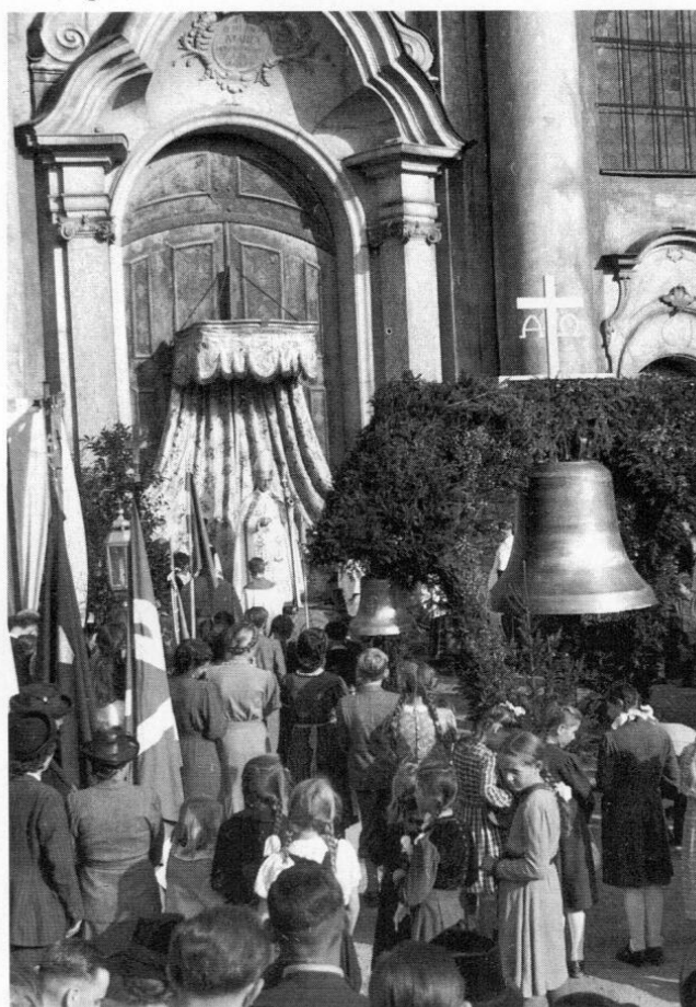
Abb. 3: Glockenweihe am 8. Oktober 1950 in Fürstenfeld. Rechts die große cis-Glocke, daneben die Bruder-Klaus-Glocke. Im Hintergrund Weihbischof Johannes Neuhäusler.

Bei der Abnahme der beiden neuen Glocken der Klosterkirche Fürstenfeld wurde auch eine Läuteordnung festgelegt. Sie sei hier kurz wiedergegeben, um exemplarisch zu zeigen, daß auch das Läuten von Glocken, wenn-