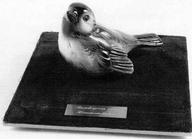
Diesen »Bundespreis der deutschen Heimatzeitschriften« verlieh der Deutsche Heimatbund am 19. Mai 1995 unserer Zeitschrift Amperland.

Zur Förderung der überwiegend ehrenamtlich herausgegebenen Heimatzeitschriften entschloß sich der Deutsche Heimatbund, Bonn, als Dachorganisation der Landesverbände für Heimatpflege in der Bundesrepublik Deutschland, einen »Bundespreis der deutschen Hei-