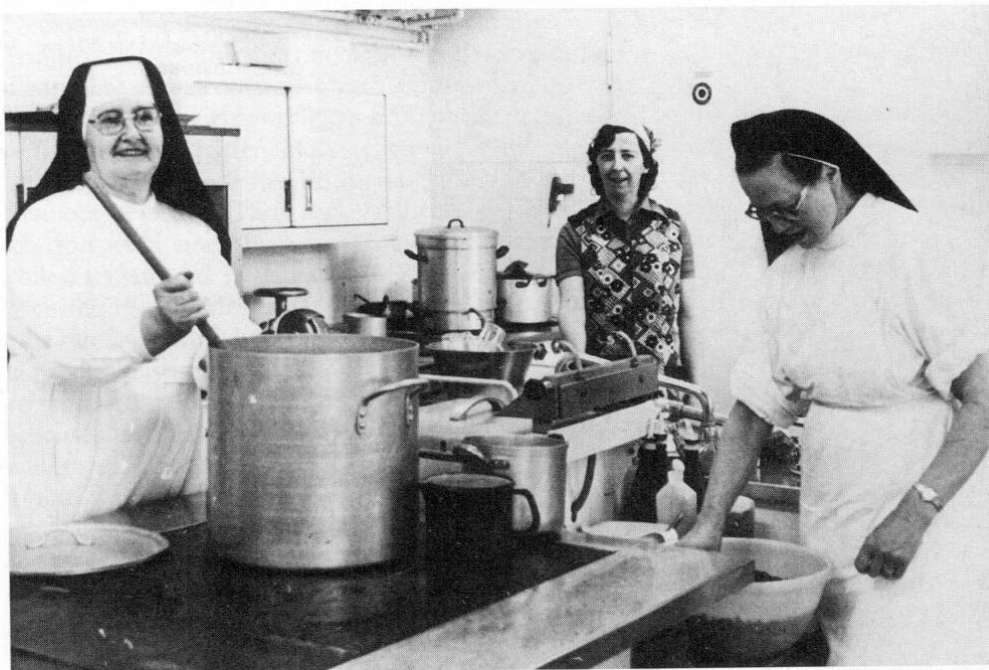
Erschwerter Kochbetrieb während des Ausbaues der Landvolkshochschule auf dem Petersberg.