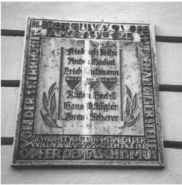
Abb. 5: Gedenktafel für die Opfer des Dachauer Aufstandes am Sparkassengebäude in Dachau