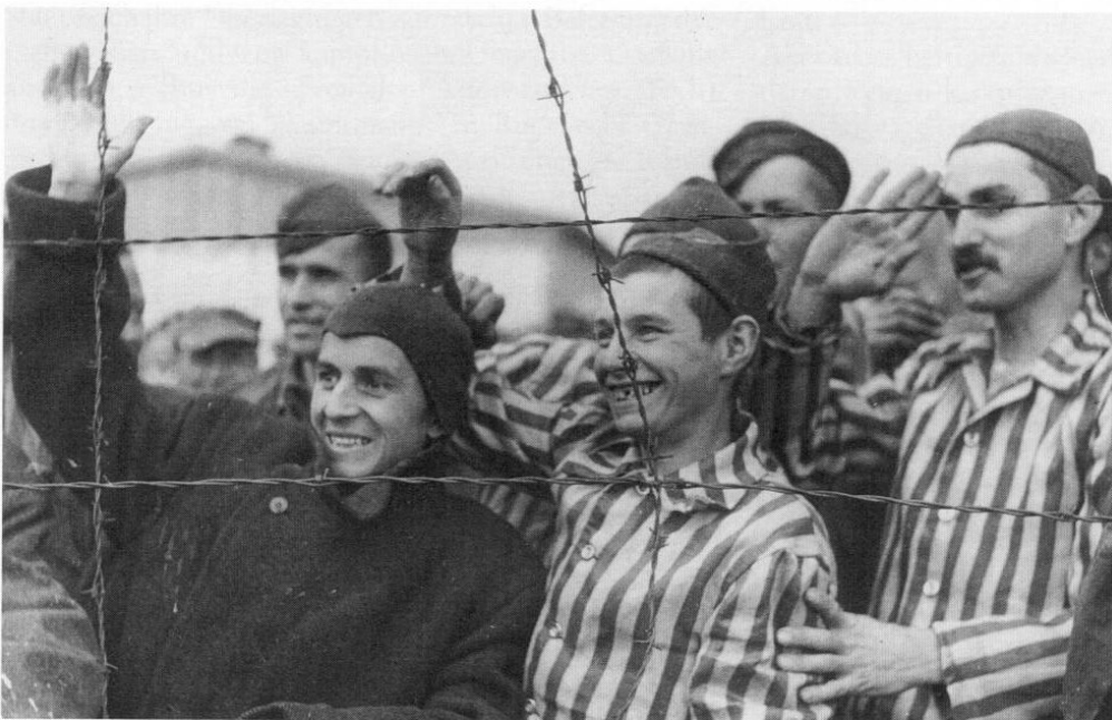
Abb. 7: Dachauer Häftlinge begrüßen voller Glück ihre amerikanischen Befreier.