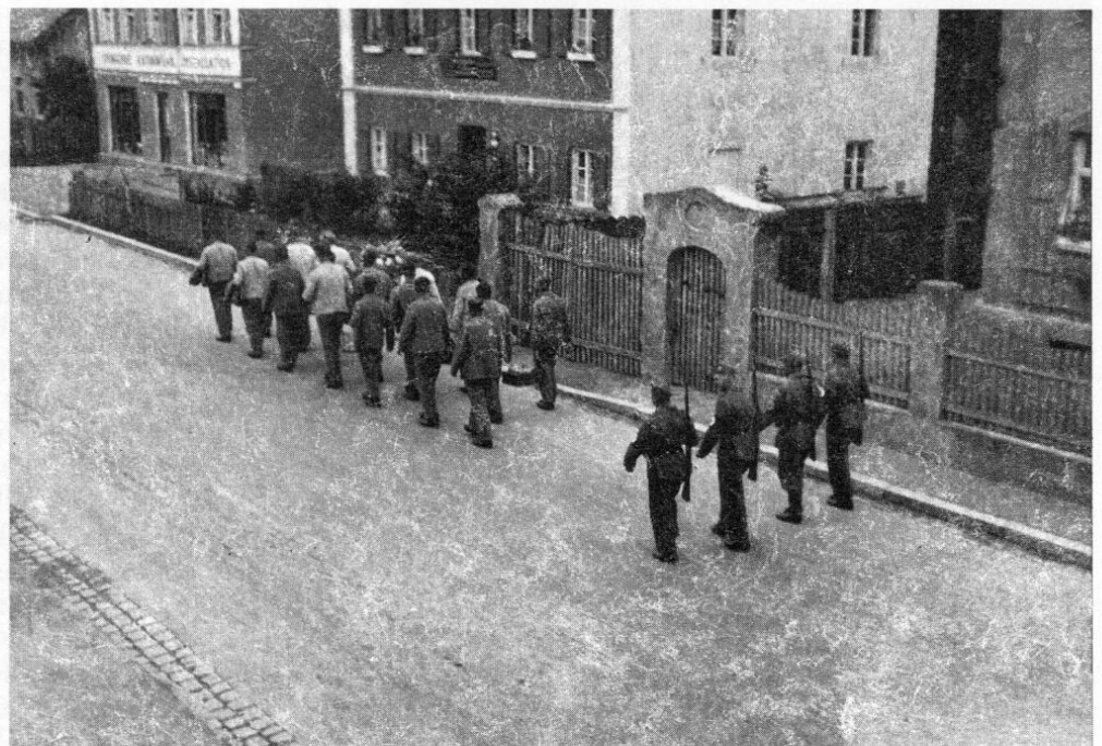
Abb. 3: Häftlinge aus dem KL Dachau kamen erst in den letzten Kriegsjahren zum Arbeitseinsatz in die Stadt Dachau. Vorher arbeiteten sie ausschließlich im Bereich des Konzentrationslagers und des benachbarten SS-Übungslagers. Das Bild, das heimlich aufgenommen wurde, zeigt ein Arbeitskommando von Gefangenen mit SS-Begleitposten in der Mittermayerstraße in Dachau.