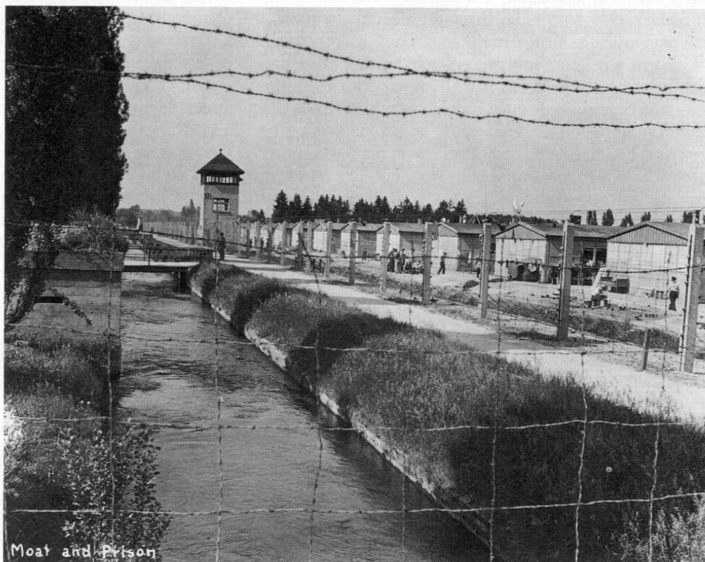
Abb. 1: In den letzten Kriegsmontaten verstärkte sich die Sorge der Dachauer SS, daß es zu einem Aufstand der Gefangenen mit anschließender Massenflucht kommen könnte. Die Kommandantur des KL Dachau ließ deshalb im Februar 1945 Betonbunker (auf dem Bild links am Wärmekanal) zur Verstärkung der Lagerbefestigung errichten, die das Häftlingslager zusätzlich absicherten.

Die Unruhe im Lager wächst. Fieberhaft sehnen die Häftlinge die Ankunft ihrer Befreier herbei. Doch viele befürchten, daß die amerikanischen Truppen, die auf Dachau vorstoßen, zu spät kommen werden. Die Pessimisten schätzen ihre Überlebenschancen gering ein. Die Folgen der Nervosität, die alle Gefangenen erfaßt hat,