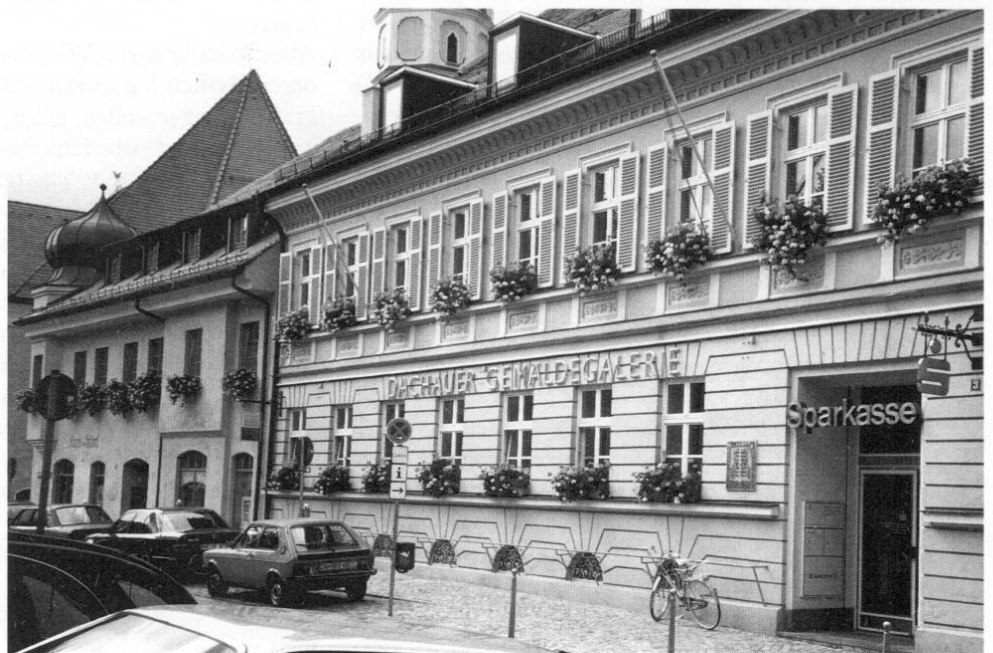
Abb. 4: Die Aufständischen, die lebend in die Hände der SS fielen, wurden an der Wand des Sparkassengebäudes, das heute die Dachauer Gemäldegalerie beherbergt, erschossen.