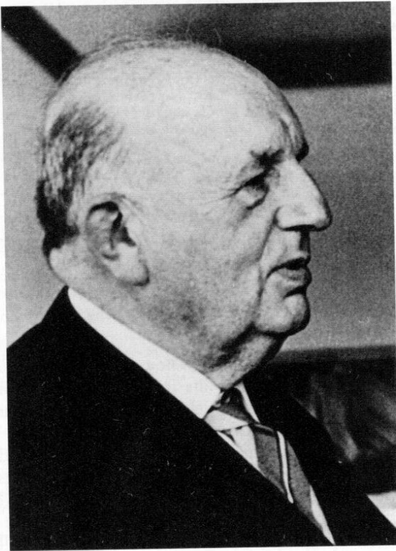
Abb. 2: Der niederländische Journalist Nico Rost, der im KL Dachau inhaftiert war, setzte sich nach seiner Befreiung leidenschaftlich dafür ein, die Dachauer Bevölkerung nicht für die Verbrechen der SS büßen zu lassen. Gegen Vorurteile wandte er sich mit dem Satz: »Die Stadt trägt keine Schuld.«