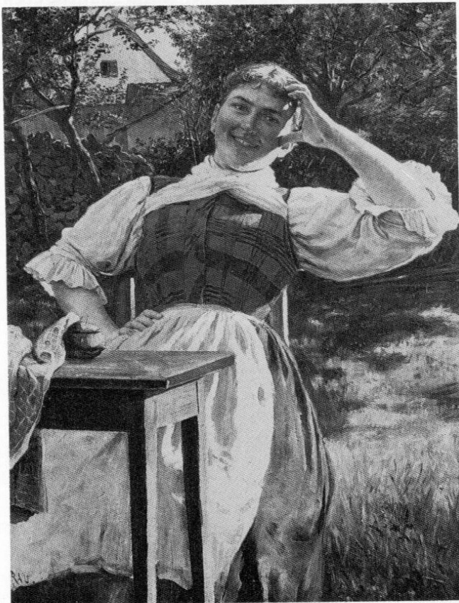
Abb. 2: »Immer fleißig«. Ölgemälde von Emil Rau, signiert und datiert (18)94, 81 x 63,5 cm. Es zeigt möglicherweise einen Brucker Garten.

Doch hin und wieder scheint er seinen alpenländischen Motiven untreu geworden zu sein. Im Jahre 1893 wurde im Glaspalast ein Gemälde mit dem Titel »Aus Emmering bei Bruck« gezeigt, das leider nicht abgebildet wurde und dessen Verbleib mir nicht bekannt ist. Ich vermute auch bei dem Gemälde »Immer fleißig«, das im Jahr darauf bei der Jahresausstellung der Münchner Künstler zu sehen war und erst kürzlich auf dem Kunstmarkt auftauchte, 15 ein Brucker Motiv. Das für Rau untypische Gemälde zeigt ein junges Mädchen in einem sonnendurchfluteten Garten, Handarbeitsutensilien vor sich auf dem Tisch, kein Gebirge, keine Berghütte im