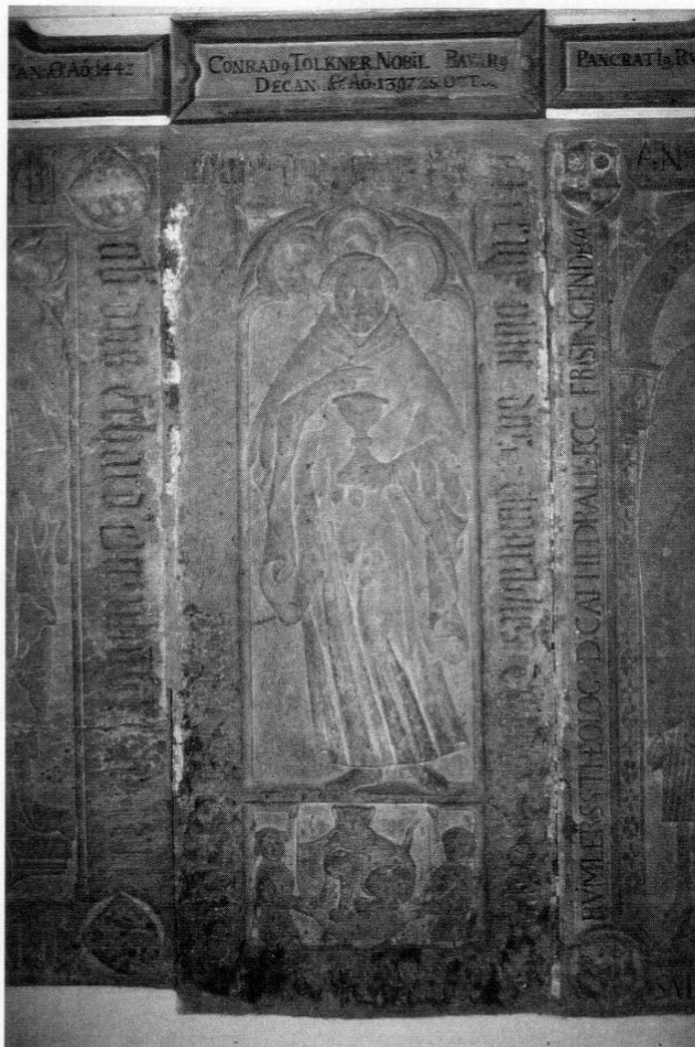
Abb. 2: Grabstein des Domherrn Konrad Tölkner († 1397) im Kreuzgang des Freisinger Domes.