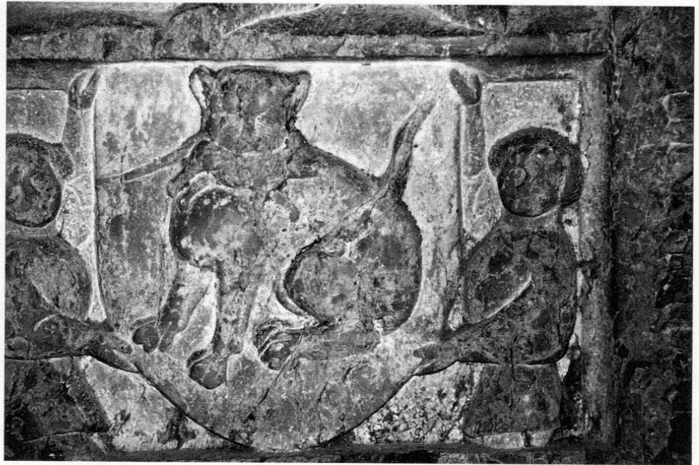
Abb. 3: Die Katze mit der Maus im Maul. Wappen am Grabstein des Domherrn Konrad Tölkenar im Kreuzgang des Freisinger Domes.

Vereins Freising (1906), S. 55, Nr. 14. – Im sogenannten »Grabsteinbuch« des Bischofs Johann Franz Eckher (München Bayerische Staatsbibliothek, cgm 2267) ist laut Schreiben der Handschriftenabteilung der Bayerischen Staatsbibliothek vom 20. Januar 1995 das Epitaph nicht beschrieben oder abgebildet.