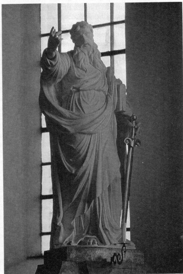
St. Paul, Hochaltarstatue des Kirchenpatrons von Franz Jakob Schwanthaler, 1801.