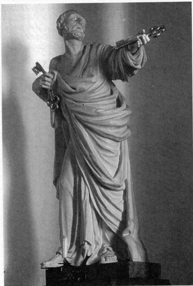
St. Peter, Hochaltarstatue des Kirchenpatrons von Franz Jakob Schwanthaler, 1801.

immer auch deren heutige Altäre hervorgehoben: »Drei Altäre des spätesten 18. Jh.; den Hochaltar flankieren lebensgroße Figuren der Patrone Peter und Paul, zusammen mit dem Gottvater im Auszug vielleicht Umkreis des Roman Anton Boos.« 2 Oder: »Altäre im Übergangsstil vom Rokoko zum Frühklassizismus mit Skulpturen in Porzellanfassung.« 3 Bei den Vorarbeiten zur Herausgabe eines Kirchenführers 4 konnten im Pfarrarchiv von