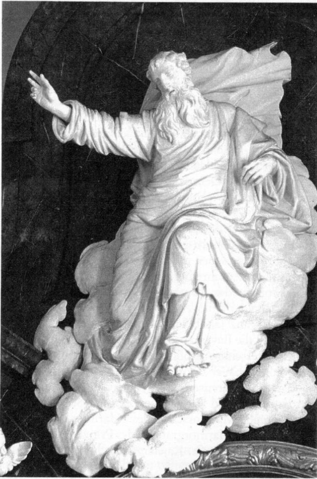
Gottvater im Auszug des Hochaltars von Franz Jakob Schwanthaler, 1801.