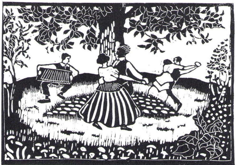
Abb. 1: Lily Koebner-Linke: Frühlingstanz im Fürmann- Garten in München 1914. Linolschnitt, 15,5 x 22 cm.