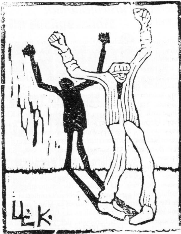
Abb. 2: Lily Koebner-Linke: Dennoch. Holzschnitt um 1918, 11,5 x 9 cm.

(das war sehr anständig, darf aber nicht mit den heutigen Maßstäben gemessen werden) nahm er Künstler in Pension, am liebsten »Maler, weil die den Stall immer wieder anstreichen konnten . . . und wenn mal jemand nicht bezahlen konnte, haute Papa Fürmann nach dem Essen mit der Faust auf den Tisch und rief zur Auktion. Der Sünder kam, brachte seine Bilder mit und es wurde so lange versteigert, bis die Schuld beglichen war. Aus diesem Grunde waren Schriftsteller nicht so sehr beliebt . . .« 3 In den dreißiger Jahren war auch dies zu Ende. Im Herbst 1935 schied Henry Fürmann freiwillig aus dem Leben – »Zeit vorbei« schreibt Prévot, war das letzte Wort seines Freundes Fürmann, der nach dem Tod seiner Frau auch nicht mehr leben wollte.