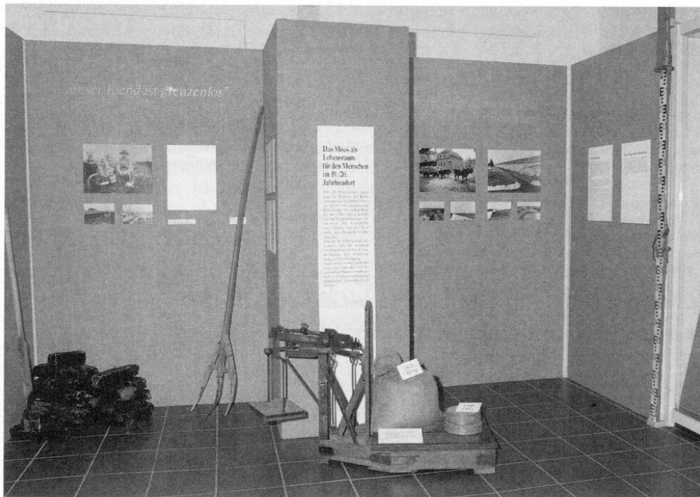
Das Moos als Lebensraum für den Menschen im 19./20. Jahrhundert (Bezirksmuseum, Raum 3).