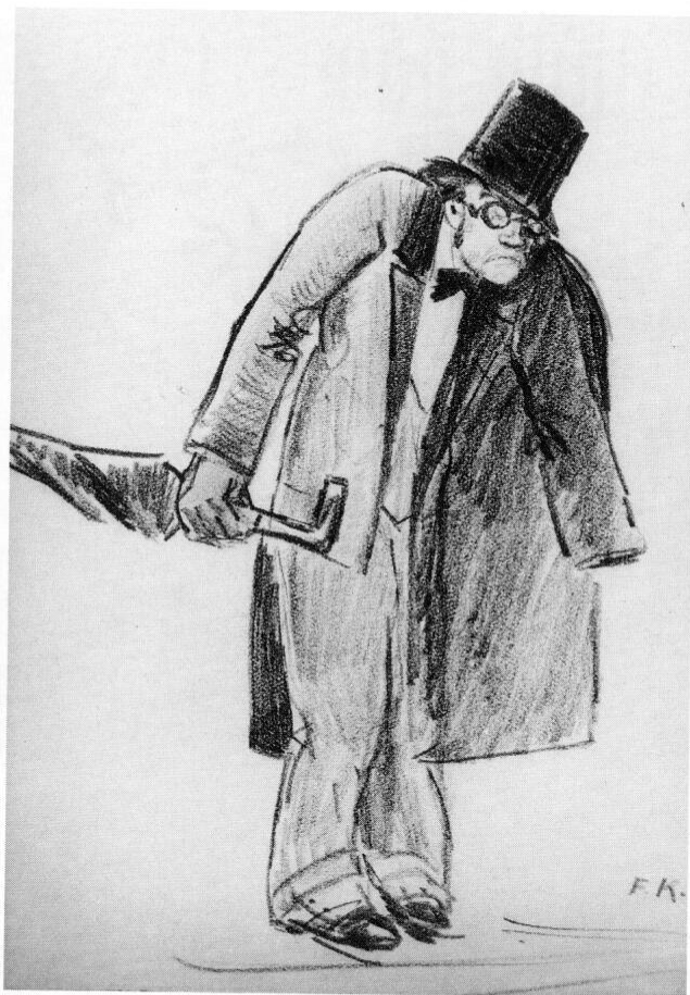
Abb. 3: Friedrich Krackhardt: Theaterbesucher. Dieser unheimlich wirkende Mann wurde 1933 skizziert.

Der große Wunsch des Künstlers, der sich ebenso als Maler wie als Zeichner verstand, noch einmal in Öl malen zu können, ging nicht mehr in Erfüllung; aber ihm galten seine letzten Gedanken. Zutiefst bedauerte er es, daß ihm ein Großteil seines künstlerischen Werkes, durch sein unstetes Leben und Sorglosigkeit bedingt, im