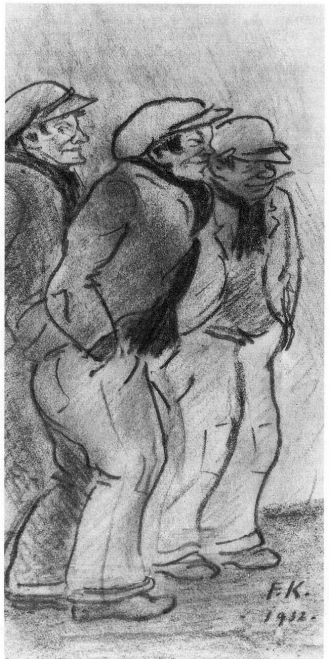
Abb. 4: Friedrich Krackhardt: Berliner Arbeiter, 1932.

1939 rückte wieder das Militär in den Vordergrund. Als er, der aufgrund seiner nationalen Gesinnung eines der ersten Parteibücher erworben hatte, dies 1942 unter Protest zurückgab, wurde er für einige als entsetzlich demütigend erlittene Monate in einer französischen Irrenanstalt »interniert« und dann zwangsweise vom Militär ausgeschlossen. Nun stellten sich zunehmend Zwangsneurosen ein, die den Umgang mit dem früher so geselligen Mann schwierig machten und nach dem Krieg auch zur Scheidung führten. Die künstlerische Tätigkeit kam