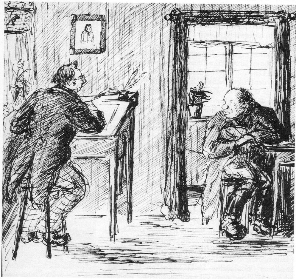
Abb. 1: Friedrich Krackhardt: Büroszene. Die mit der Feder gezeichnete Szene entstand Ende der dreißiger Jahre in München.

Besonders gelungen erscheinen figürliche Szenen aus